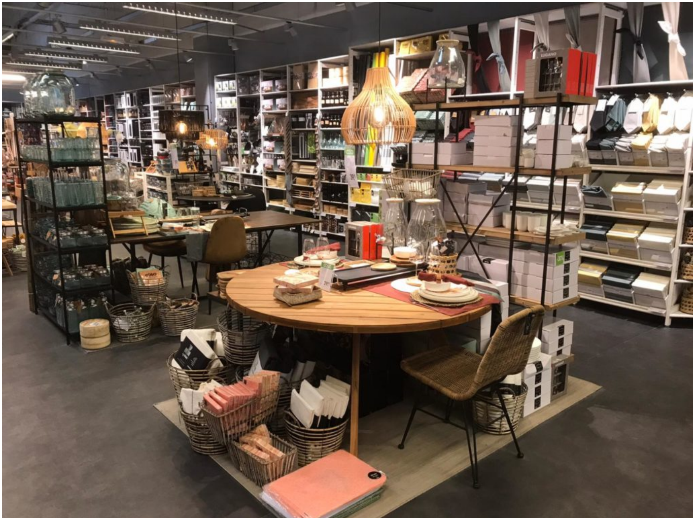
Boutique Casa Vedène.