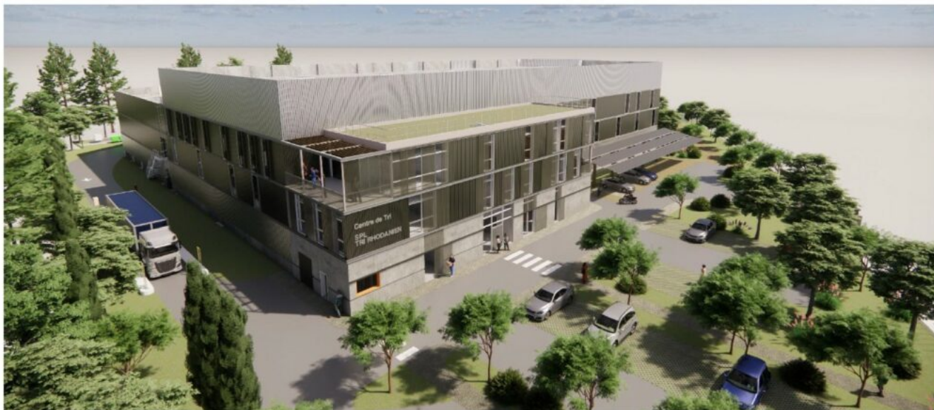
Vue axonométrique du projet- AT&E Architectes

La SPL Tri Rhodanien a franchi une étape décisive avec la signature d'un Marché Public Global de Performance pour la conception, la construction et l'exploitation d'un centre de tri des emballages et papiers à Vedène. Un équipement structurant, mutualisé entre collectivités,