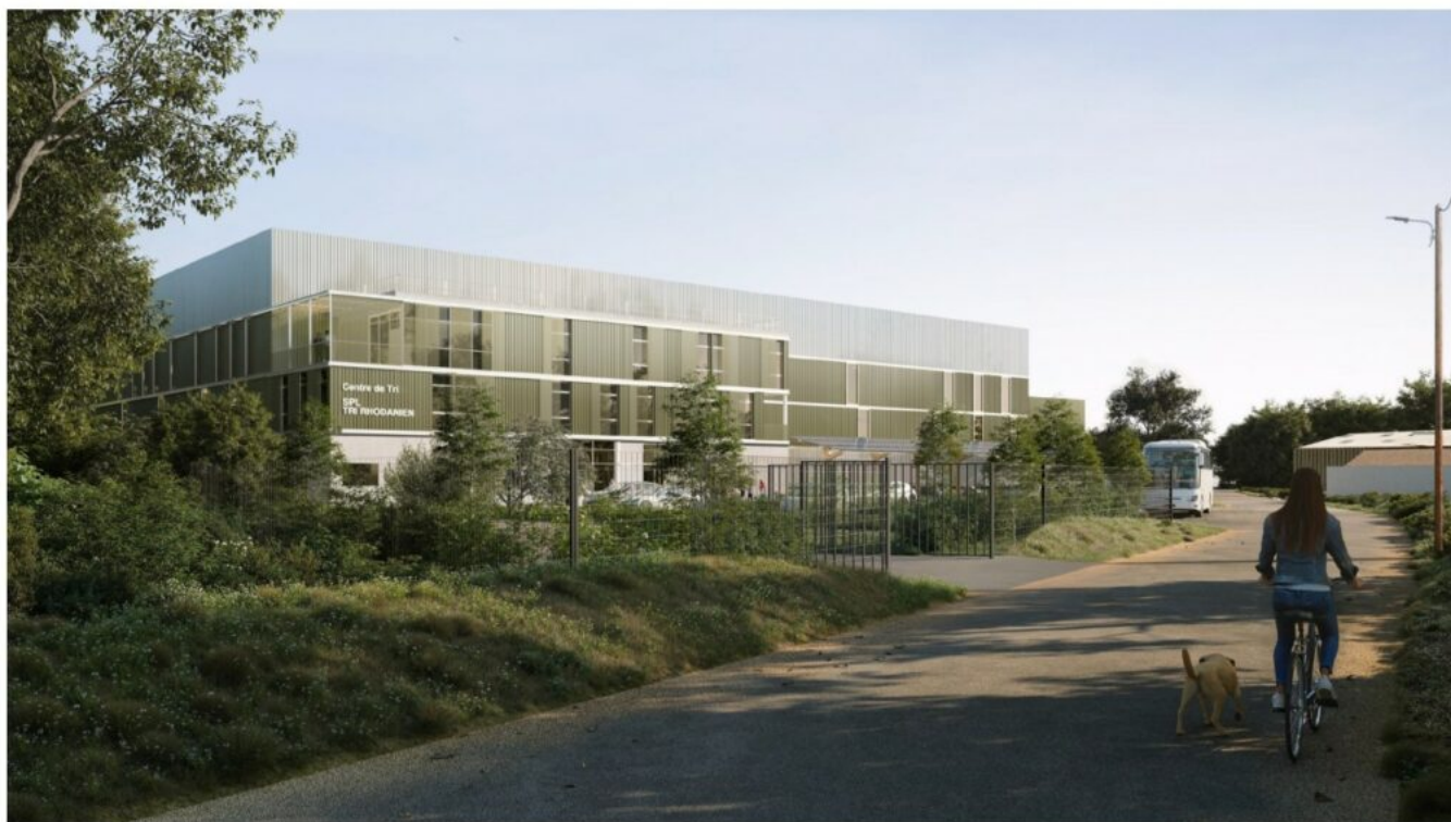
Vue du projet depuis le chemin de Capeau – AT&E Architectes