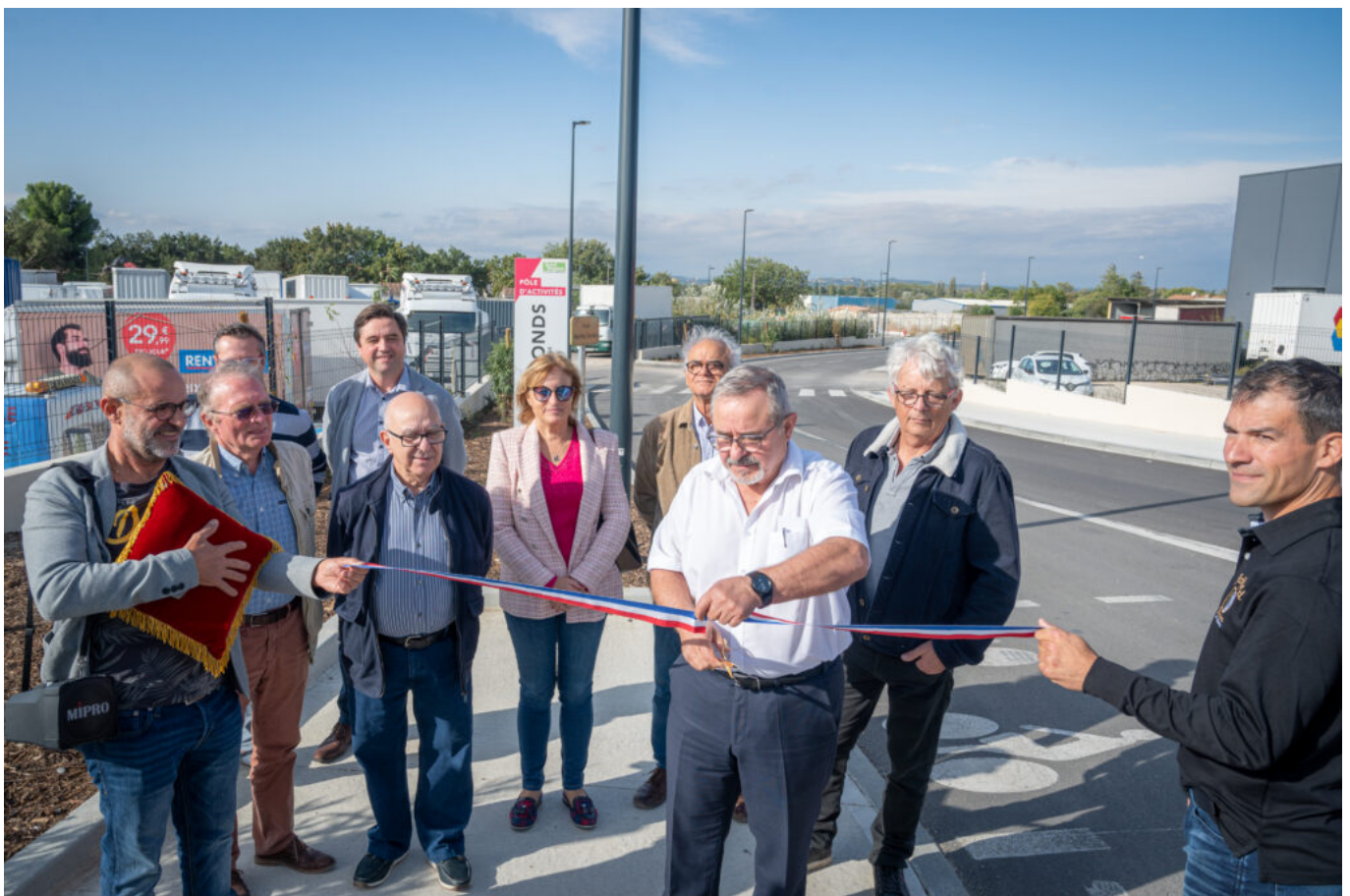
Joël Guin, président du Grand Avignon, a inauguré les travaux

Les travaux ont consisté en la pose de revêtements de chaussée et de trottoirs larges pour la circulation des piétons ; La végétalisation des espaces publics dans la rue Marthe Condat sur 330m 2 d'espaces avec des plantations méditerranéennes à faible consommation d'eau et en l'installation de totem à l'entrée de la zone d'activités.