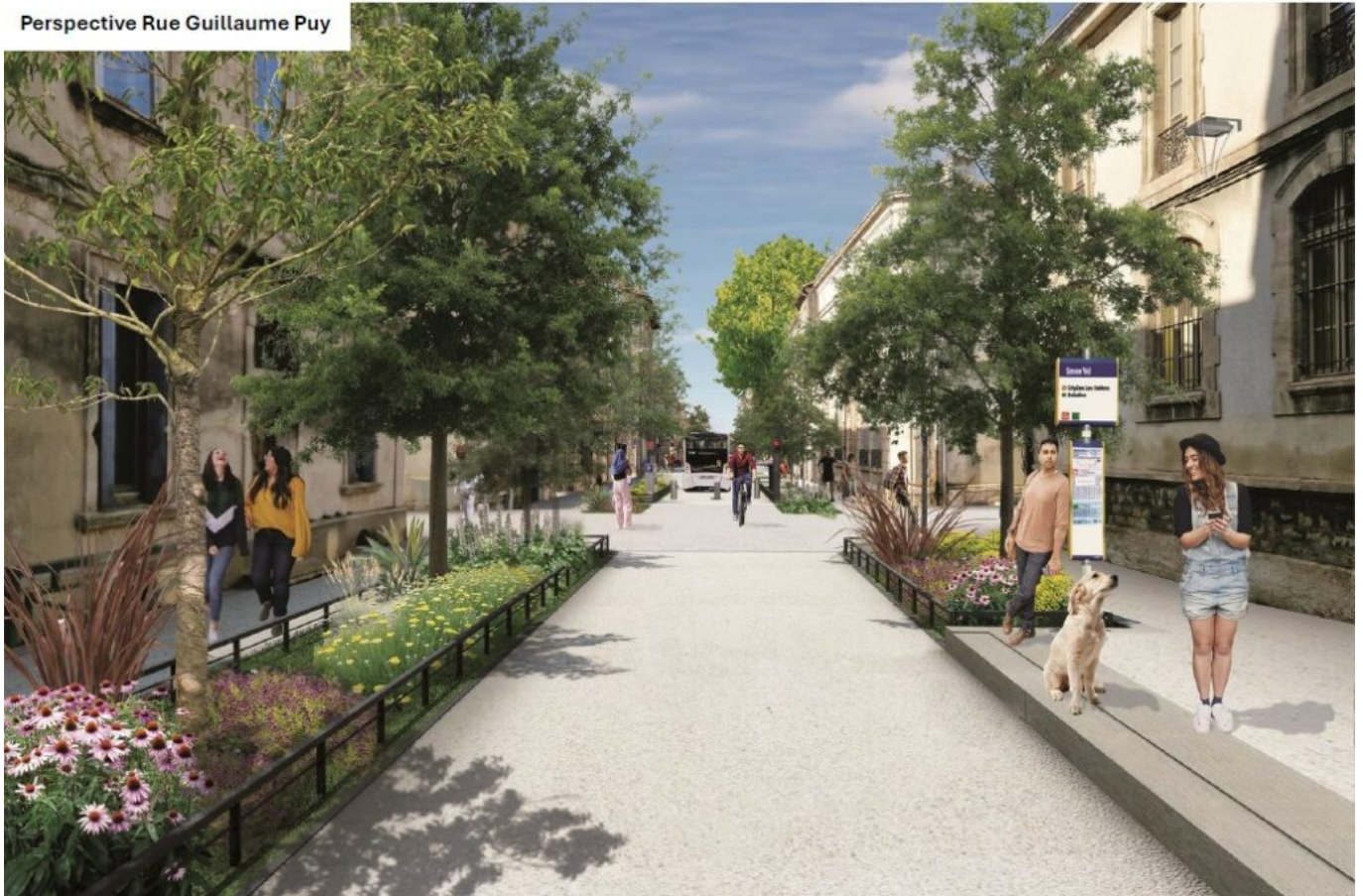
Perspective Rue Guillaume Puy

Les travaux de réhabilitation de la rue Thiers vont reprendre maintenant, s'étendre jusqu'en décembre et devraient avoisiner les 3,7M€. Objectif : arborer et végétaliser la ville pour en 'upgrader' le cadre de vie. Mission ? Redonner leur place aux habitants, familles, écoles et commerces de l'intramuros où le tout voiture avait jusqu'alors, préempté la vie sociale.