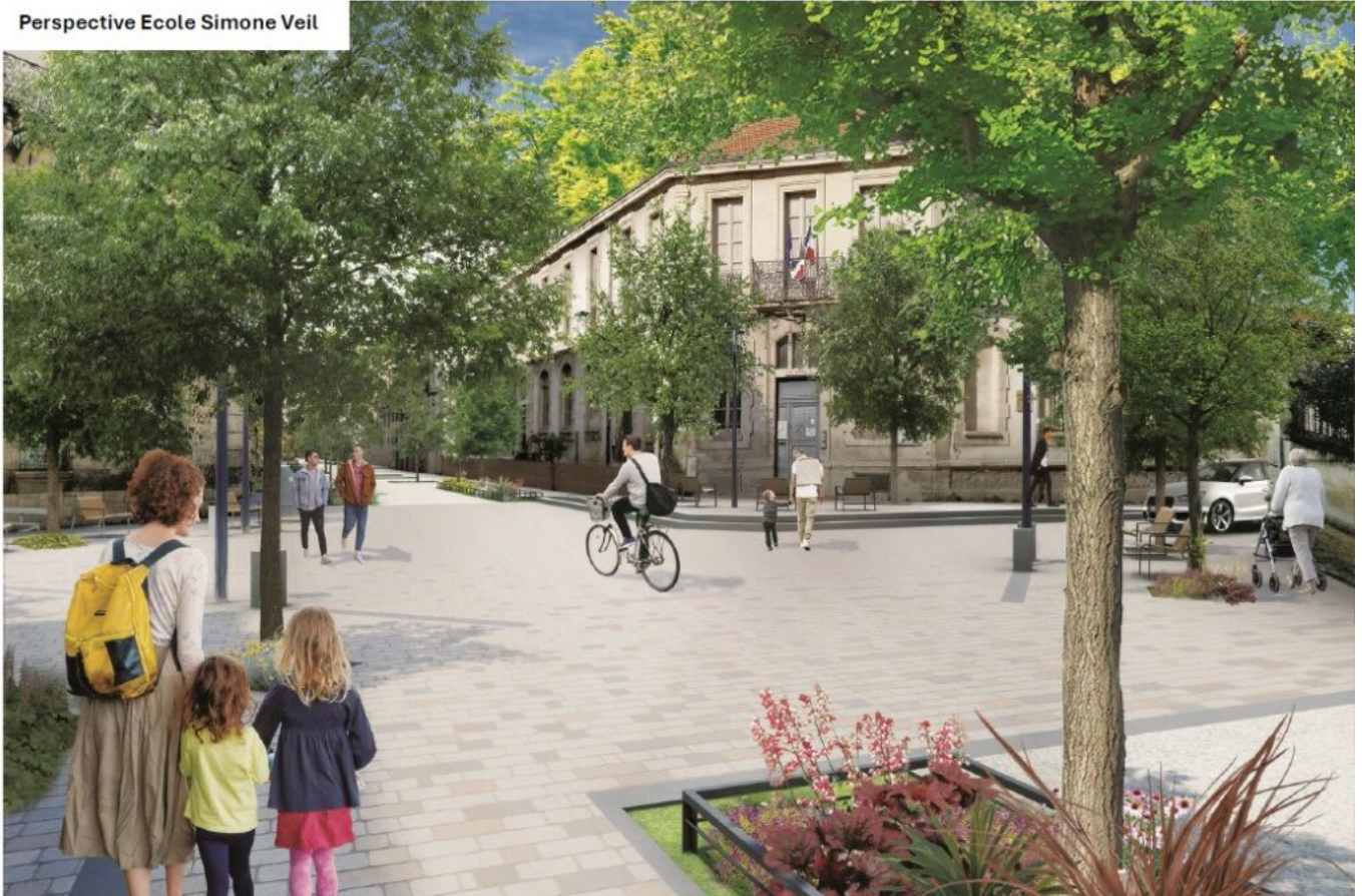
Perspective Ecole Simone Veil

Le parvis de l'école Simone Veil (ex école Thiers) bénéficiera de la requalification de la rue Thiers