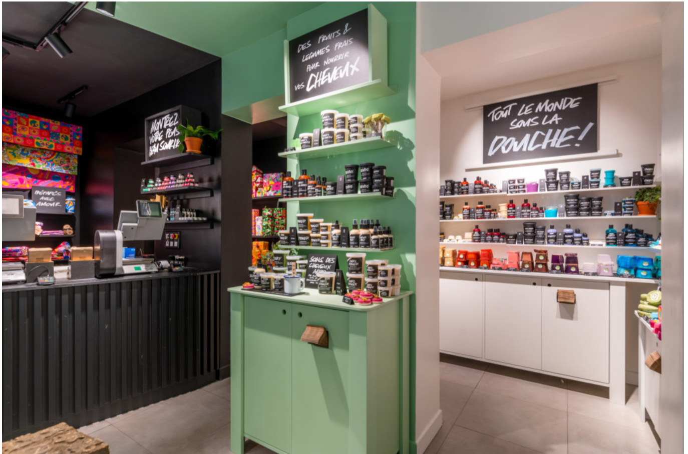
Boutique Lush Boulogne-Billancourt, illustration.

des équipes en boutique. Un univers à rebours de la cosmétique traditionnelle qui, selon les chiffres, ne cesse de conquérir des adeptes. Implanté dans 48 pays avec 928 points de vente et plus de 9000 collaborateurs, Lush affichait en 2019 un chiffre d'affaires de 1139 millions d'euros.