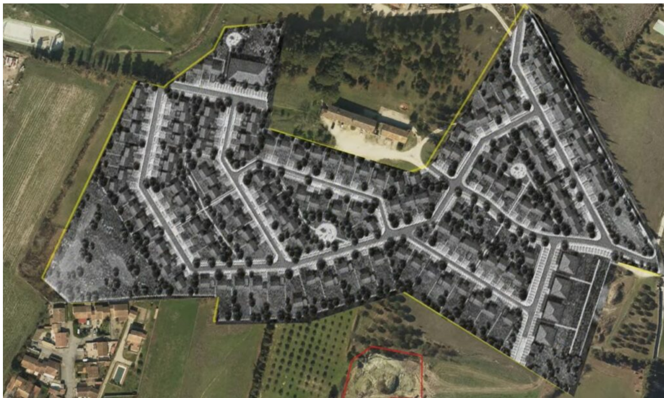
Le projet de lotissement de la Grande Bastide prévoit la création de 200 logements et l'arrivée de 500 à 700 habitants.

« Avec le Zan (Zéro Artificialisation nette), nous serons dans l'impossibilité totale de créer des logements car à Velleron, en raison de nos zones naturelles ou du PPRI (Plan de prévention des risques naturels d'inondation) nous ne disposerons pas du foncier nécessaire pour pouvoir répondre aux nouvelles obligations qui vont être générées par la réalisation ce lotissement. Nous devons donc payer des pénalités ad vitam æternam puisque nous n'atteindrons jamais les objectifs de la SRU. C'est le serpent qui se mord la queue. »