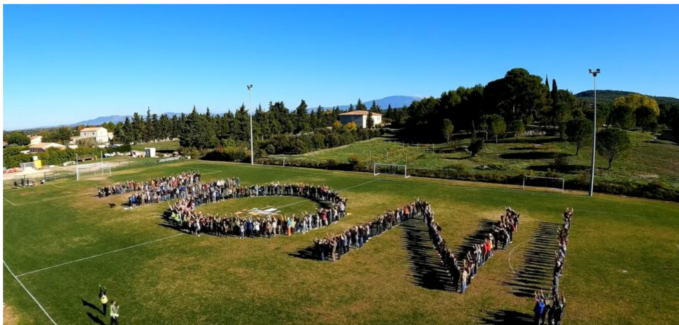
Lors d'un des précédents rassemblements, les habitants avaient écrits un gigantesque 'Non' sur le terrain de football de la commune.

« Notre évaluation n'intègre pas les dépenses des autres collectivités (Grand Avignon, Département de Vaucluse, Région Sud...) qui devront participer, d'une manière ou d'une autre, elles aussi aux financements de tous ces travaux » alerte le maire. « Et les financements qui seront mis ici, ne pourront pas aller ailleurs. Si on prend l'exemple du Grand Avignon, cela se fera au détriment d'autres raccordements à l'assainissement. En gros, si nous voulions équilibrer nos comptes, il nous faudrait augmenter les impôts de 40% ! »