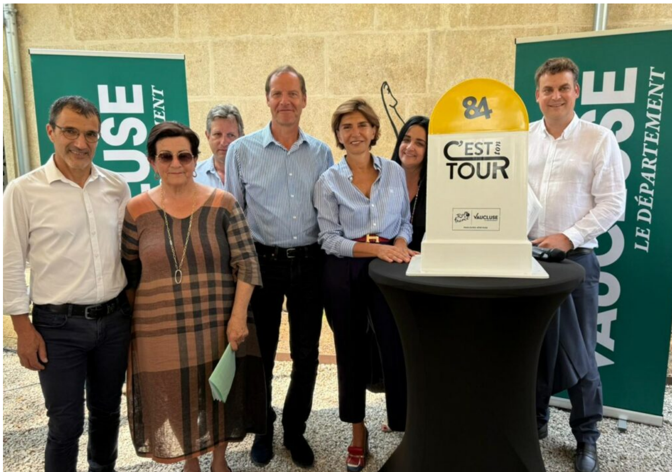
Christian Prudhomme, directeur du tour de France, avec les élus de Vaucluse.

Christian Prudhomme, directeur du tour de France