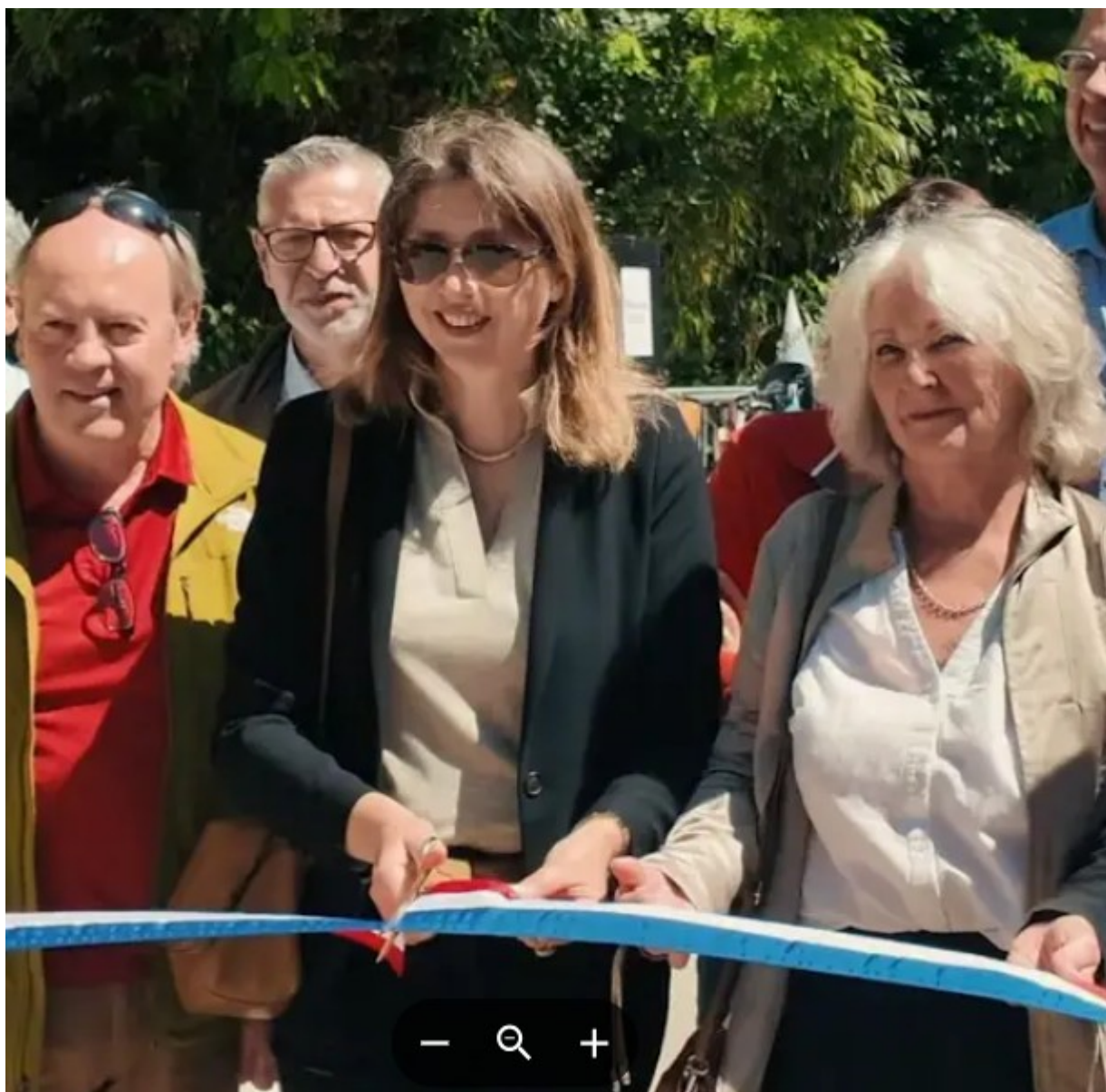
Pascale Borie Copyright Villeneuve-lès-Avignon Communication