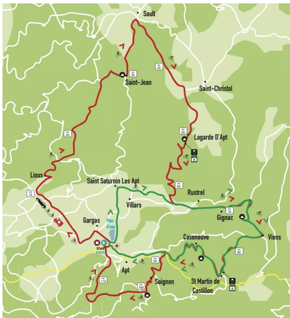
Les deux parcours.

Le second parcours, quant à lui, fait 50 km avec 722 m de dénivelé. Les participants, au départ du plan d'eau d'Apt, se dirigeront vers Saint-Saturnin-lès-Apt, Rustrel, Gignac, Viens, Saint-Martin-de-Castillon, Caseneuve, avant de revenir à Apt. Ce parcours, qui est une randonnée non chronométrée, a la particularité d'être ouvert aux vélos à assistance électrique.