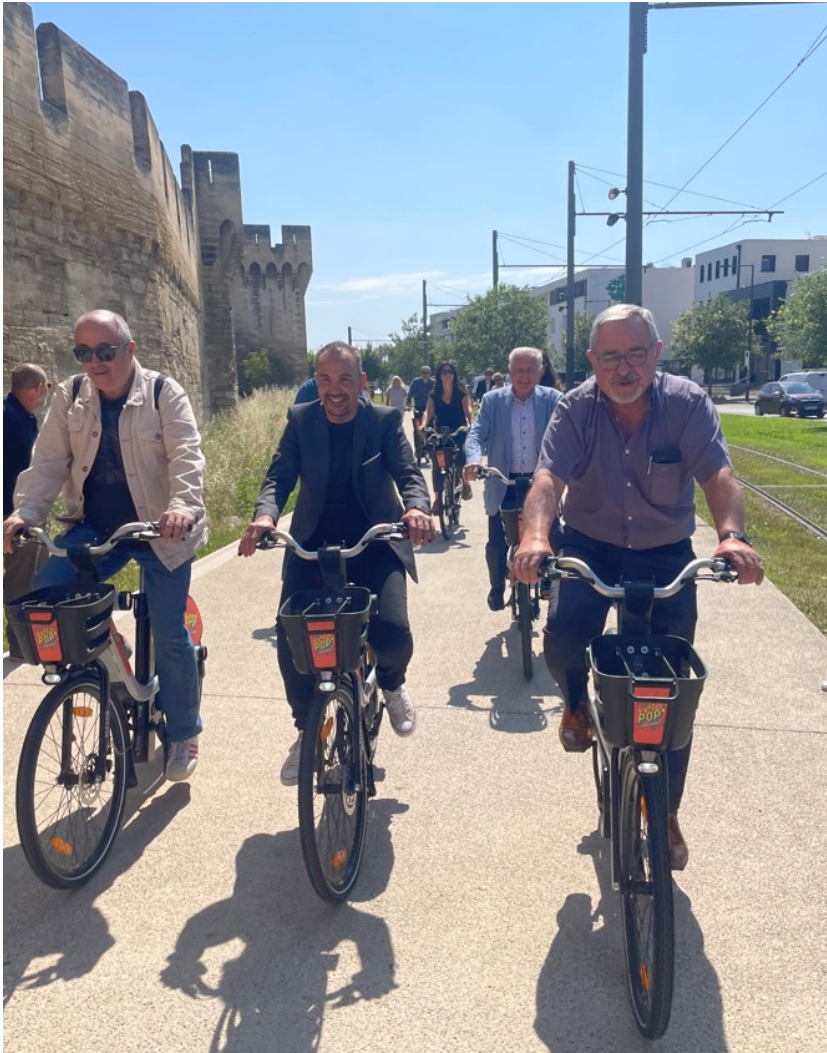
A droite, le président du Grand Avignon : Joël Guin.

Pour ce nouveau lancement, le coût d'investissement pour le Grand Avignon s'élève à environ 1,35M€, couvrant l'achat du matériel, les installations et la mise en place des stations. Un projet qui a bénéficié d'une subvention de l'Etat à hauteur de 59% dans le cadre du dispositif Fonds vert destiné à accélérer la transition écologique.