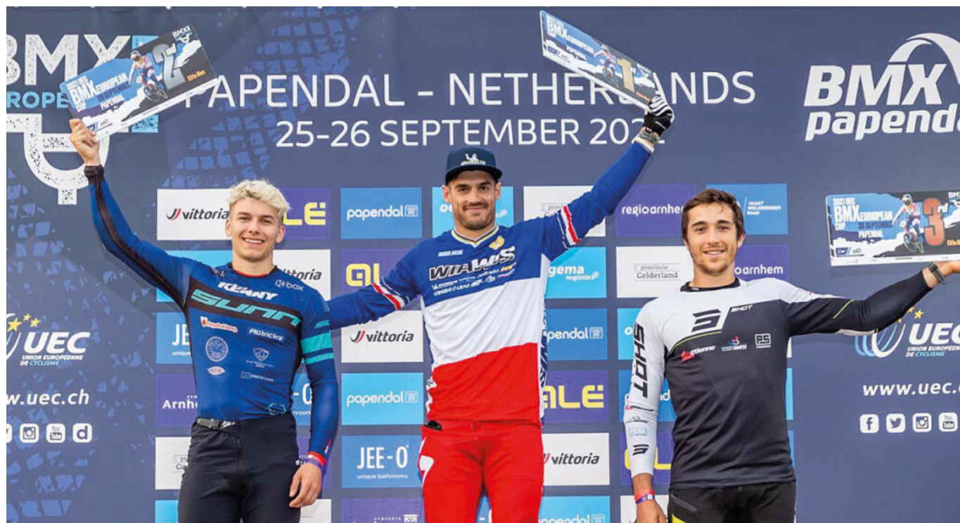
Sylvain André, vainqueur de la coupe du monde de BMX Racing 2022