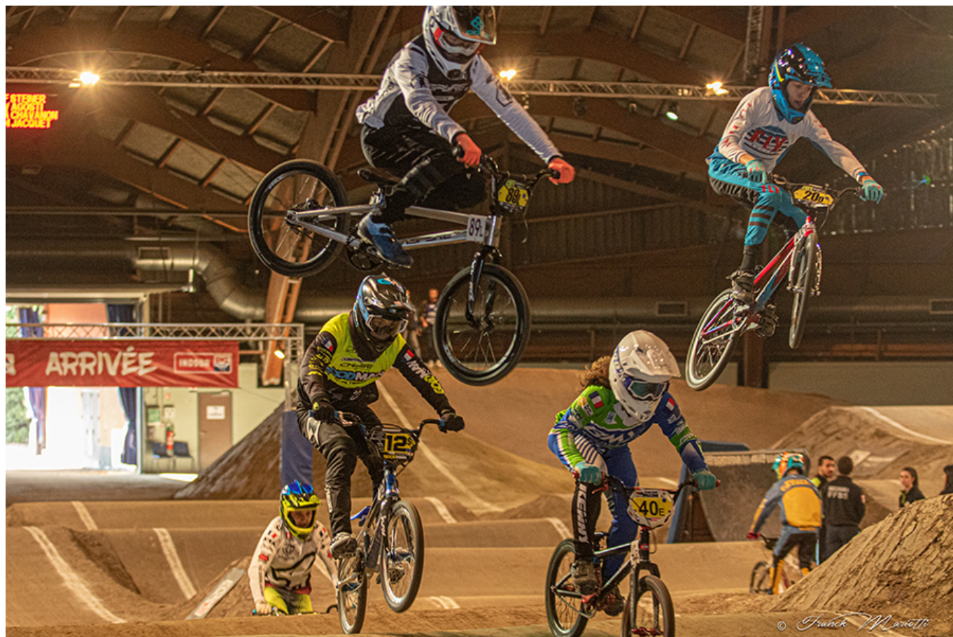
Indoor BMX pour les audacieux.

cargo, BMX, draisienne... Sur près de 35.000 m 2 , un village d'exposants, des animations, des événements sportifs, des rencontres avec les professionnels ainsi que de nombreux temps forts permettront de découvrir le vélo autrement. Trois jours de grand spectacle organisés par la ville d'Avignon et Avignon Tourisme, avec le soutien de la Région sud, du Département de Vaucluse, du Grand Avignon et de la Fédération française de cyclisme de Vaucluse.