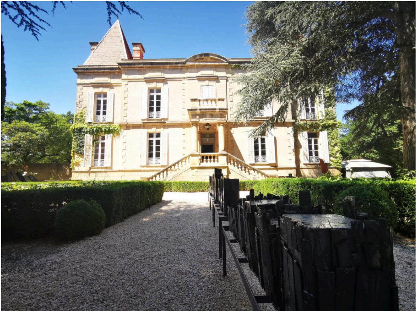
Château de Bosc