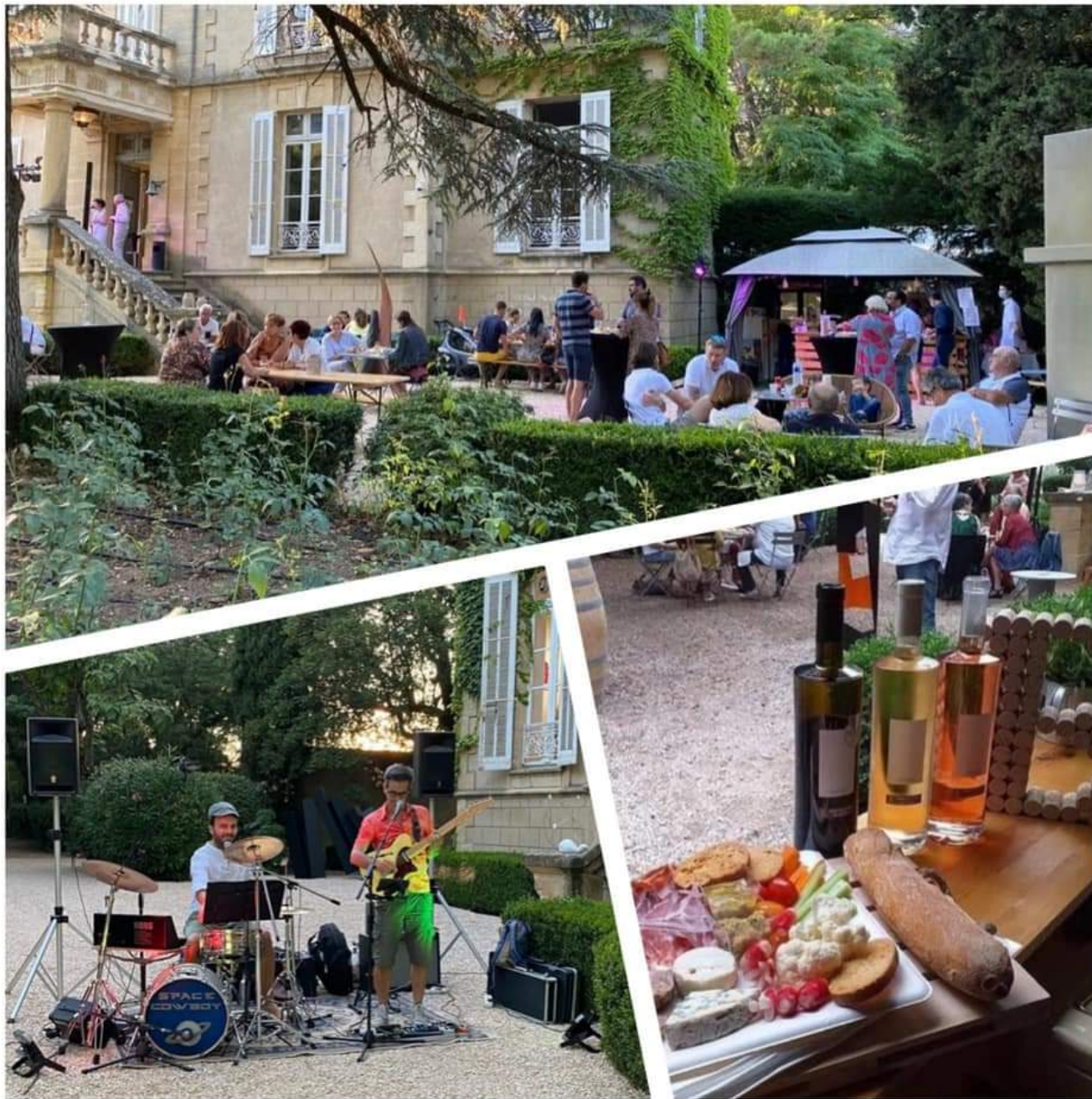
Photo : château de Bosc.