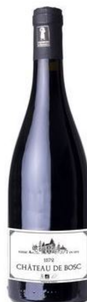
Château de Bosc Rouge 2019

Depuis 2010, son vin sans sulfites, cuvée Artémis, est mis dans le commerce sans problème de vieillissement particulier. D'autre part l'impact qualitatif est perceptible : « nous avons des vins mieux définis, plus ronds, plus gras, moins impactés par le SO2... cela permet d'avoir des vins avec un meilleure amplitude, par contre, ces vins-là nécessitent une stratégie technique où il faut être méthodique et rigoureux... » Aujourd'hui le vigneron peut présenter une « verticale » ininterrompue (un échantillon de la même cuvée sur plusieurs millésimes successifs) de 10 années disponible uniquement pour les scientifiques ou les professionnels.