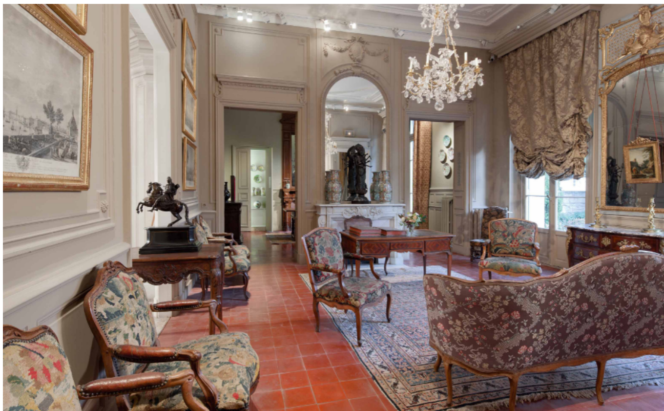
Un des salons du Musée Louis Vouland