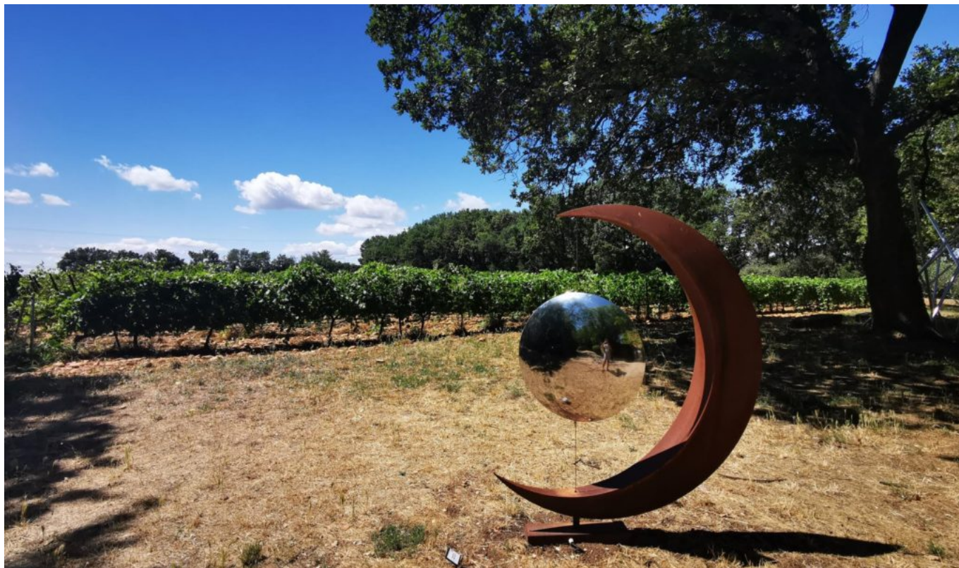
Château de Bosc