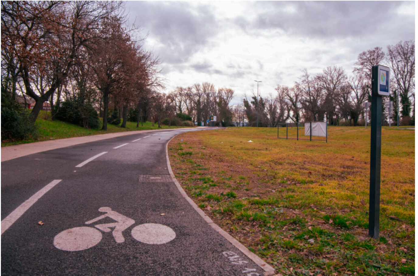
Travaux véloroutes Calavon-Cavaillon