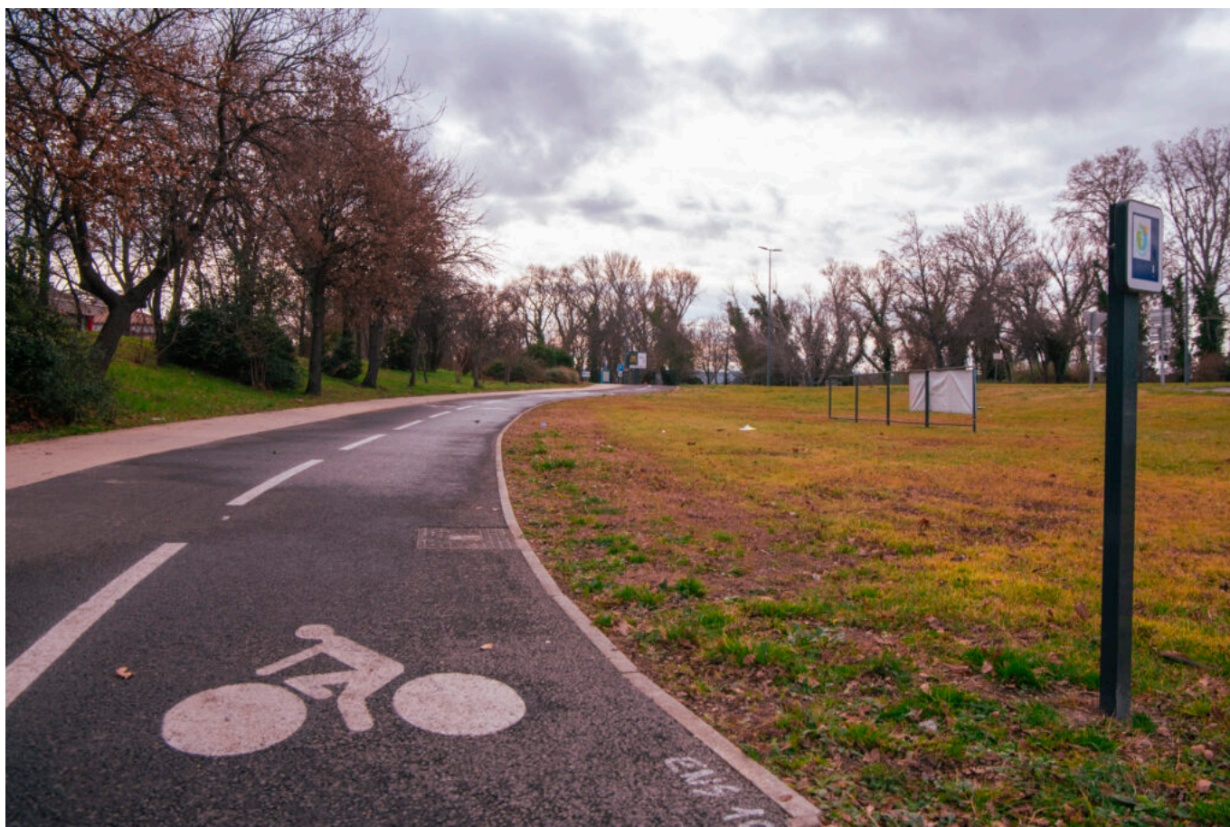
Travaux véloroutes Calavon-Cavaillon