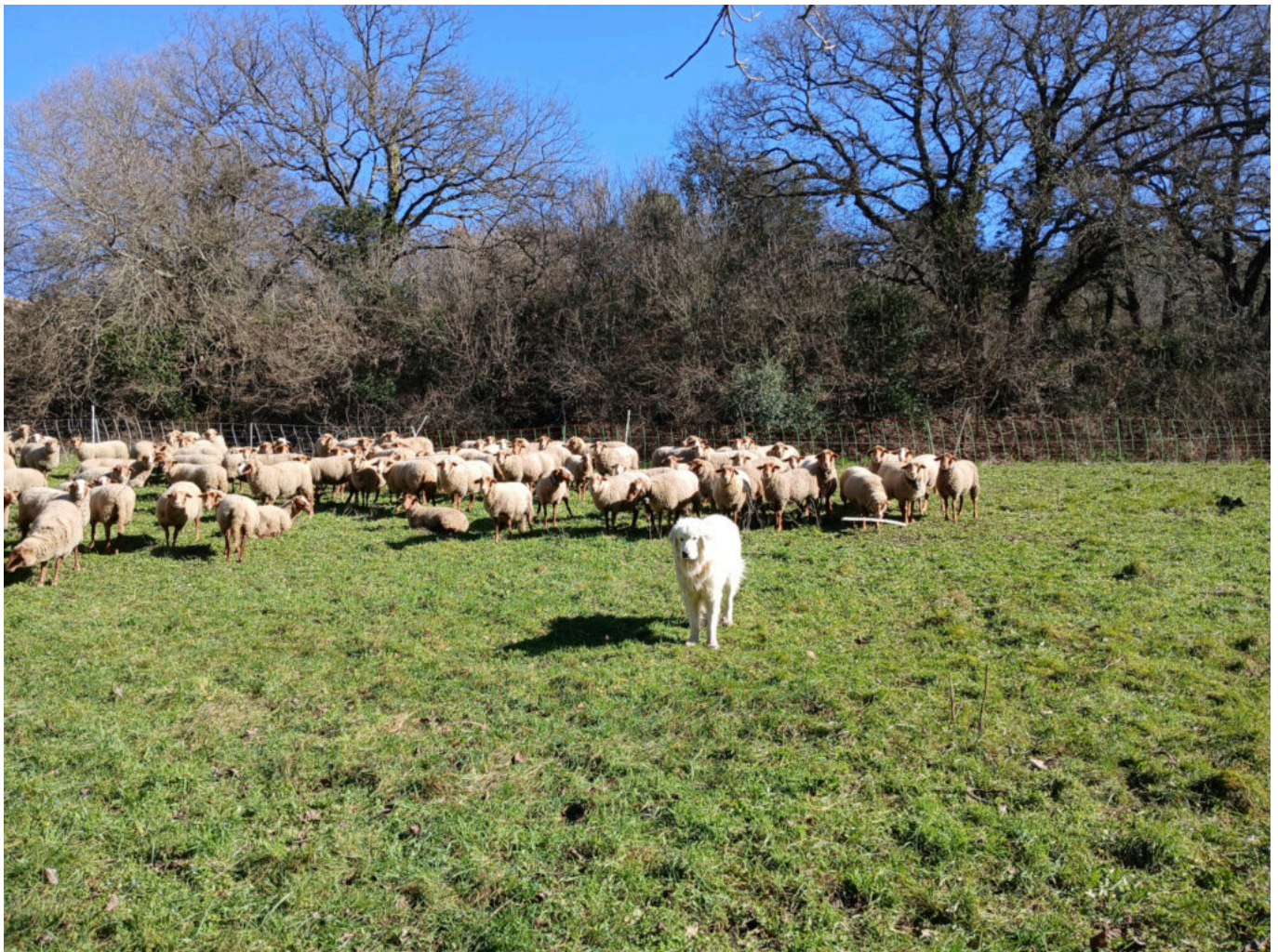
Chien de protection, le patou et un troupeau de brebis

À Caromb, la tombée du jour devient un théâtre noir et silencieux. Longtemps entourée de croyances obscures, la chauve-souris continue de nourrir fantasmes et peurs irrationnelles. Pourtant, derrière son vol imprévisible se cache l'un des mammifères les plus précieux de nos écosystèmes. Lors de la sortie « Chauve qui peut ! », proposée avec le Naturopère , les participants sont invités à dépasser les légendes pour découvrir l'animal avec sa morphologie étonnante, sa navigation par ultrasons, sa fragilité, aussi, face aux bouleversements environnementaux. Puis vient le moment où la lumière baisse réellement. Lampe torche en main et détecteur d'ultrasons à l'oreille, chacun s'avance dans l'obscurité avec cette sensation d'entrer dans un territoire qui appartient à un autre monde. Le Ventoux révèle alors son visage nocturne, discret fourmillant de vie. Chauve qui peut ! Caromb, vendredi 22 mai de 20h à 22h. Prévoir son pique-nique.