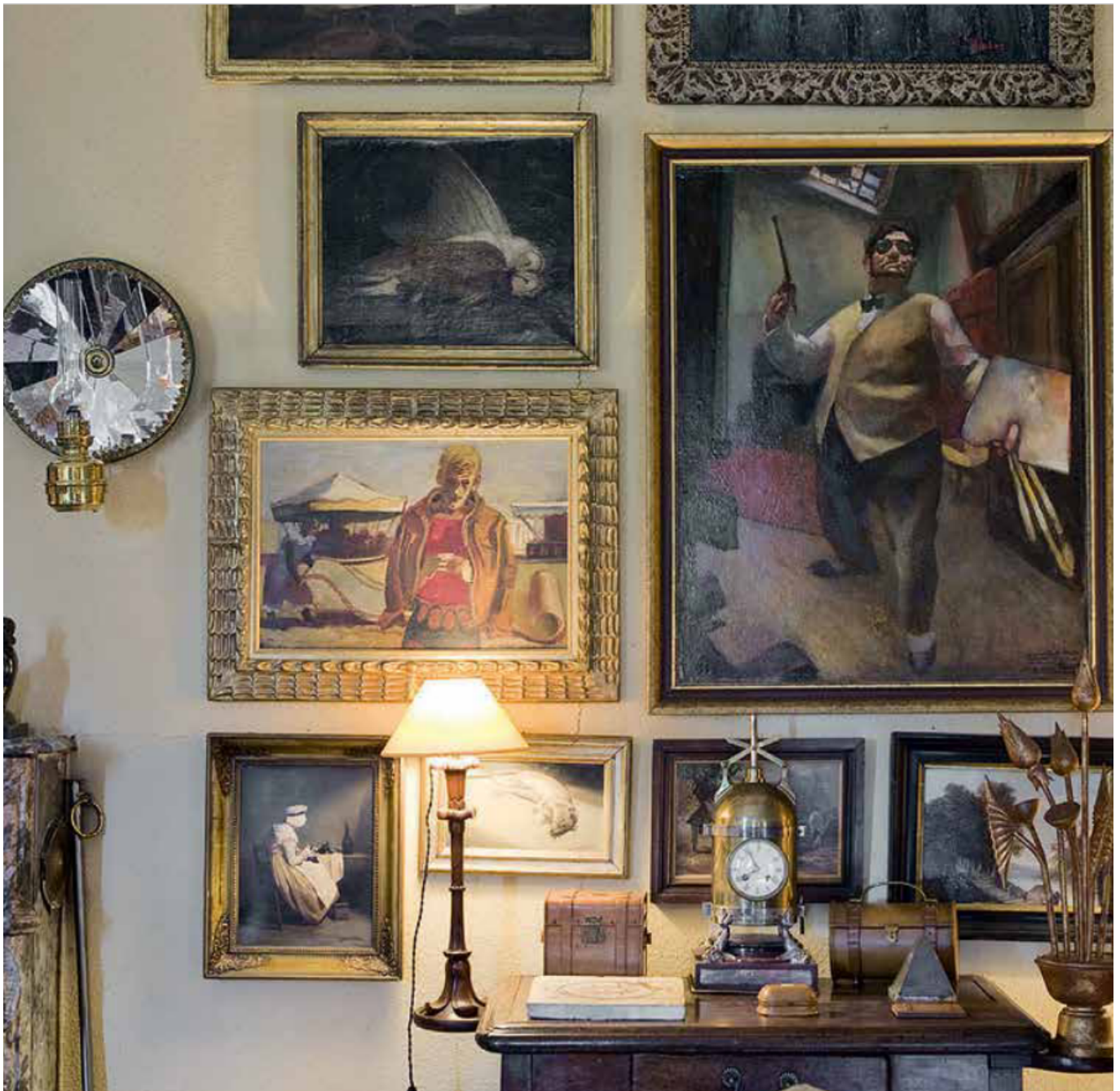
Une vie d'échanges et de rencontres