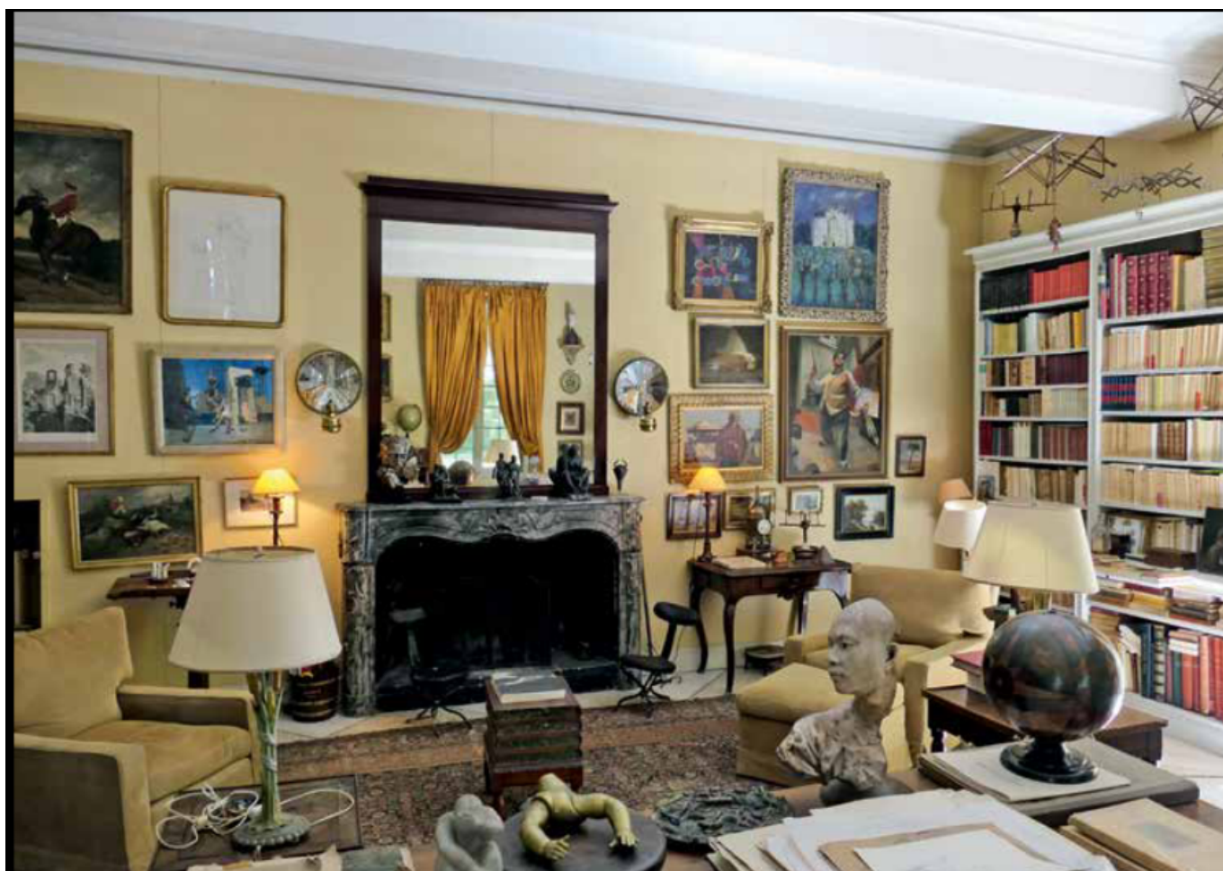
Une vie de coups de coeur