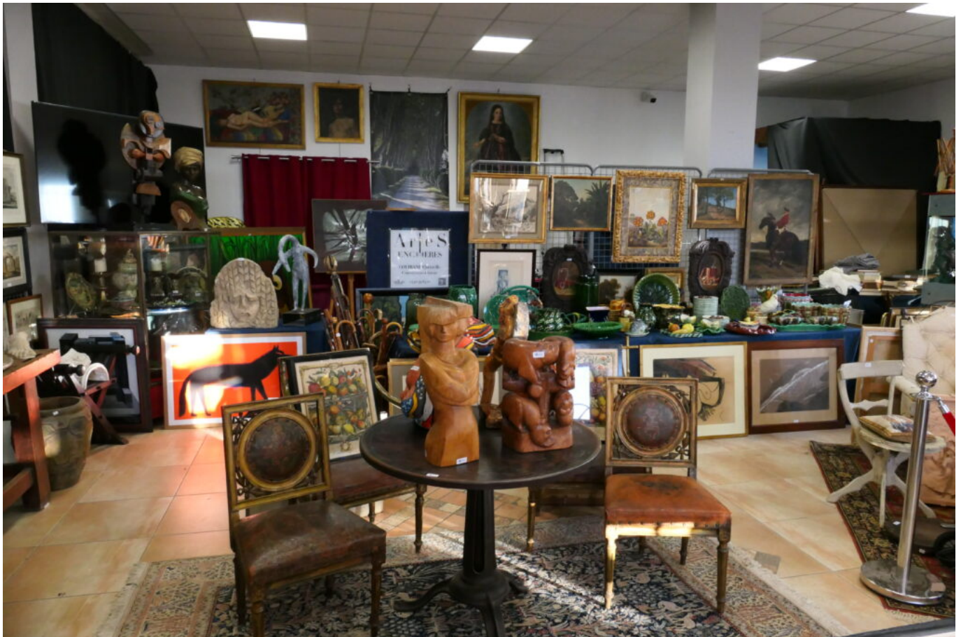
Exposition de la collection Emile Garcin

«Est-ce que je suis stressée avant la vente ? Oui, très, très. Comment je me prépare ? Je m'isole dans un coin, je pense à la vente, je me mets dans ma bulle. Je me prépare mentalement. Le début de la vente ? C'est le plus dur. Il faut mettre l'ambiance, emporter les gens avec soi, créer les conditions de l'envie d'acheter. Est-ce que les gens me contactent à l'avance en me disant qu'ils sont intéressés par certains lots ? Oui, bien sûr, et je garde tout cela secret. On ne peut pas non plus préjuger de ce qui va se passer. C'est la surprise pour tout le monde y compris pour nous. Il y a des lots que l'on met très longtemps à préparer et qui passent en quelques minutes. On n'a pas le temps de penser, de s'attacher au lot qu'il est déjà passé. Une enchère dure très peu de temps. Le maillet a à peine frappé que vous êtes déjà passé au lot suivant. Il faut tenir le rythme.»