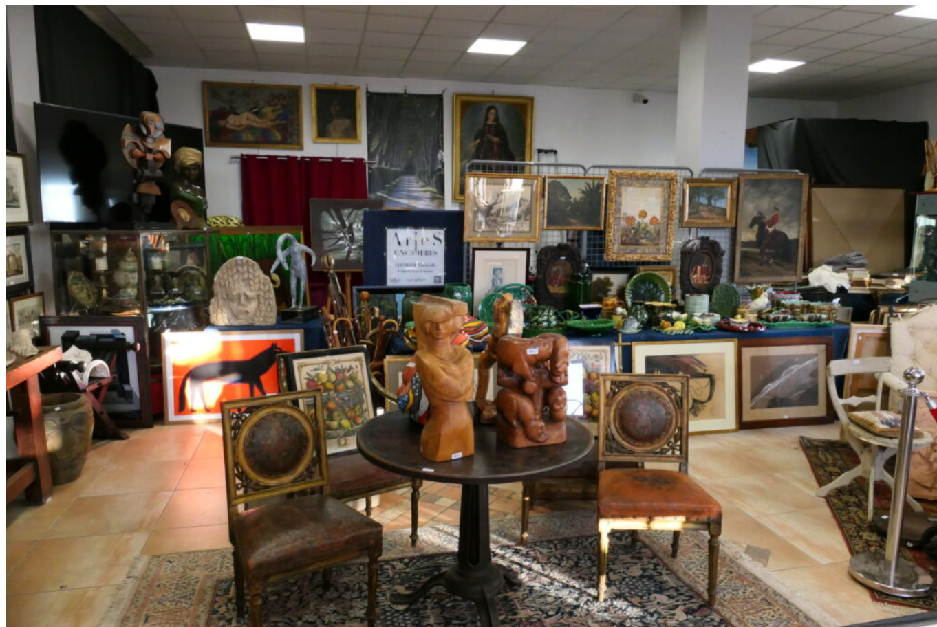
Exposition de la collection Emile Garcin

«Est-ce que je suis stressée avant la vente ? Oui, très, très. Comment je me prépare ? Je m'isole dans un coin, je pense à la vente, je me mets dans ma bulle. Je me prépare mentalement. Le début de la vente ? C'est le plus dur. Il faut mettre l'ambiance, emporter les gens avec soi, créer les conditions de l'envie d'acheter. Est-ce que les gens me contactent à l'avance en me disant qu'ils sont intéressés par certains lots ? Oui, bien sûr, et je garde tout cela secret. On ne peut pas non plus préjuger de ce qui va se passer. C'est la surprise pour tout le monde y compris pour nous. Il y a des lots que l'on met très longtemps à préparer et qui passent en quelques minutes. On n'a pas le temps de penser, de s'attacher au lot qu'il est déjà passé. Une enchère dure très peu de temps. Le maillet a à peine frappé que vous êtes déjà passé au lot suivant. Il faut tenir le rythme.»