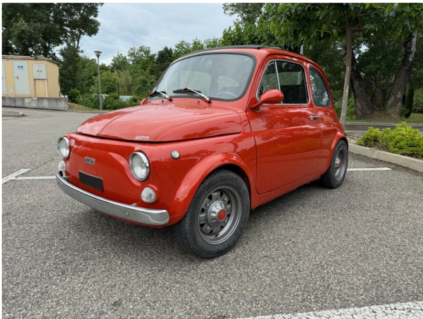
Fiat 500 (1973)