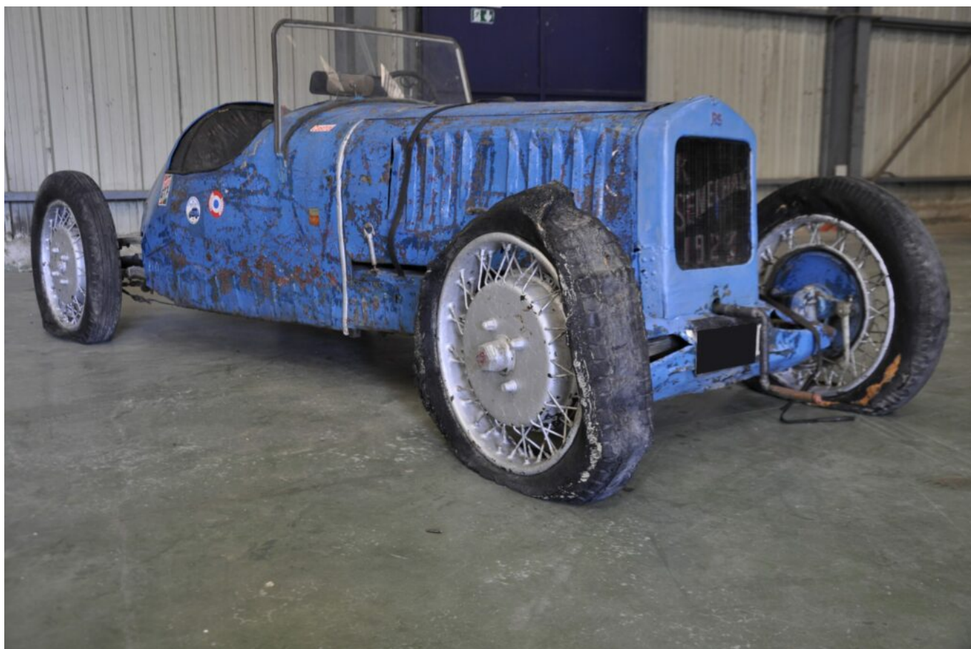
Senechal type SS2 (1924)