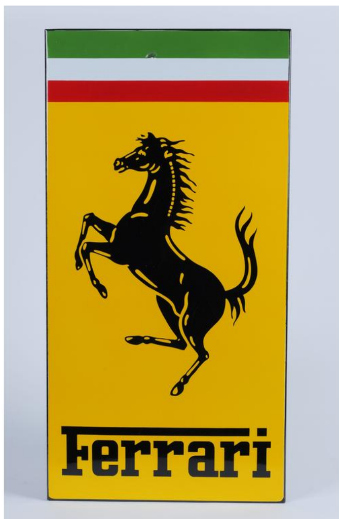
Plaque émaillée Ferrari (années 1960/1970)