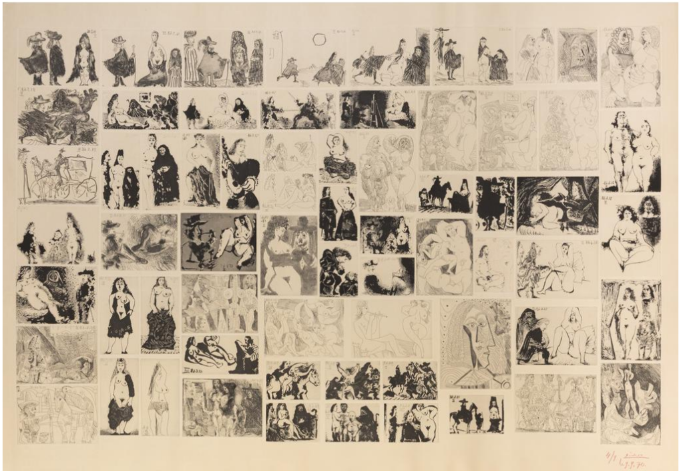
Picasso pour Célestine

Avignon. Hôtel des ventes. Samedi 26 mars. 9h30 et 14h15. Exposition vendredi 25 mars de 14h à 18h et le matin de la vente, samedi 26 mars, de 9h à 9h30. 2, rue Mère Teresa à Avignon 04 90 86 35 35 contact@avignon-encheres.com www.avignon-encheres.com