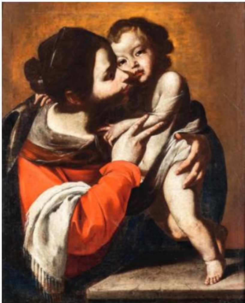
Vierge à l'enfant attribuée de Bernardo Cavallino, école Napolitaine du XVIIe siècle