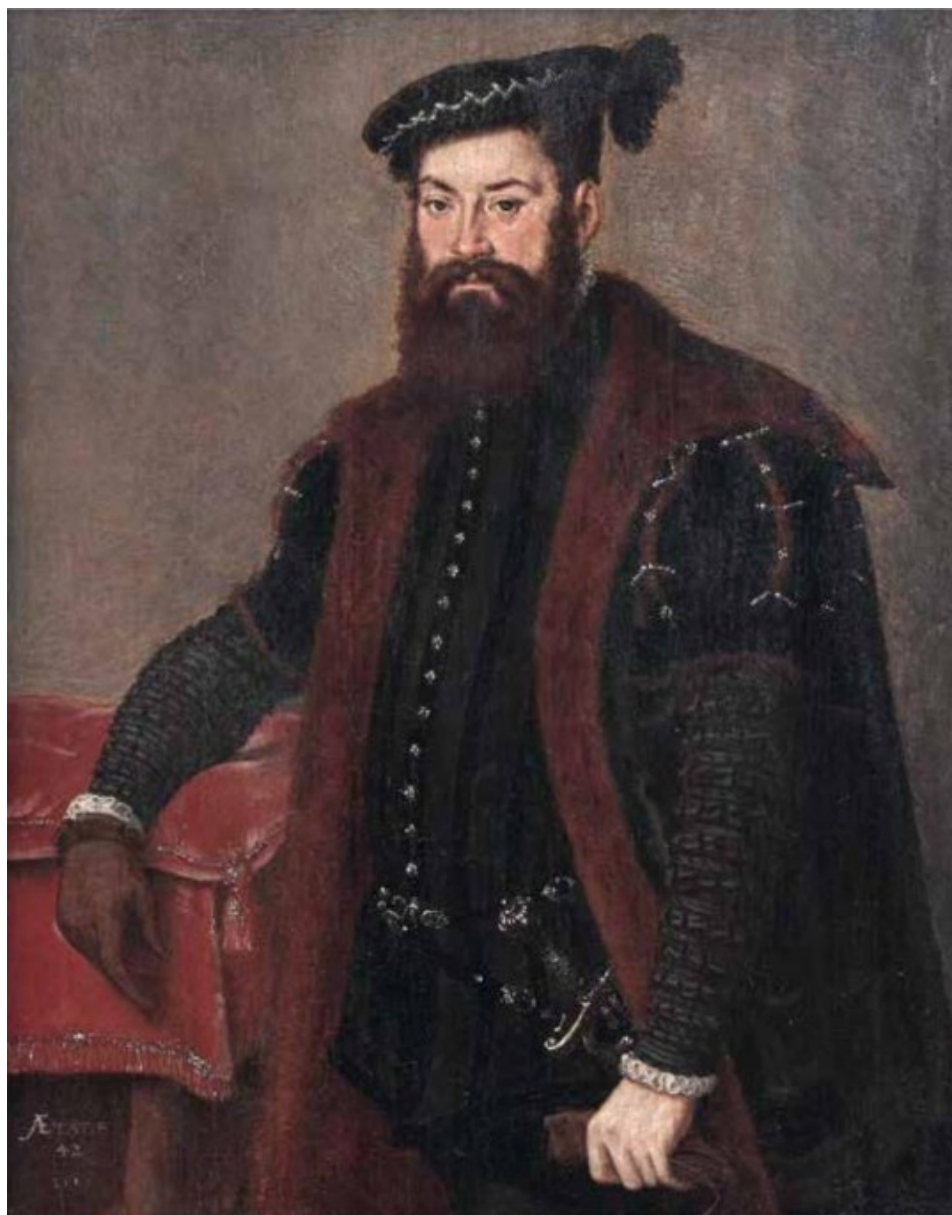
ATTRIBUÉ À HANS EWORTH (1520-1573) : Portrait présumé d'Edward Seymour.