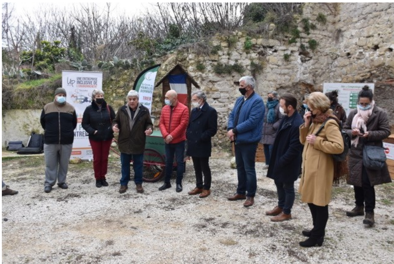
Inauguration du compost à Mormoiron.

A ce jour, une vingtaine de personnes utilisent les zones de compostage partagé et apportent leur déchets de cuisine dans les bioseaux distribués par l'intercommunalité. Les premières quantités de biodéchets seront évaluées d'ici 2 à 3 mois, « mais l'accueil des habitants et le remplissage des bacs d'apport sont déjà très encourageants », se réjouit la collectivité.