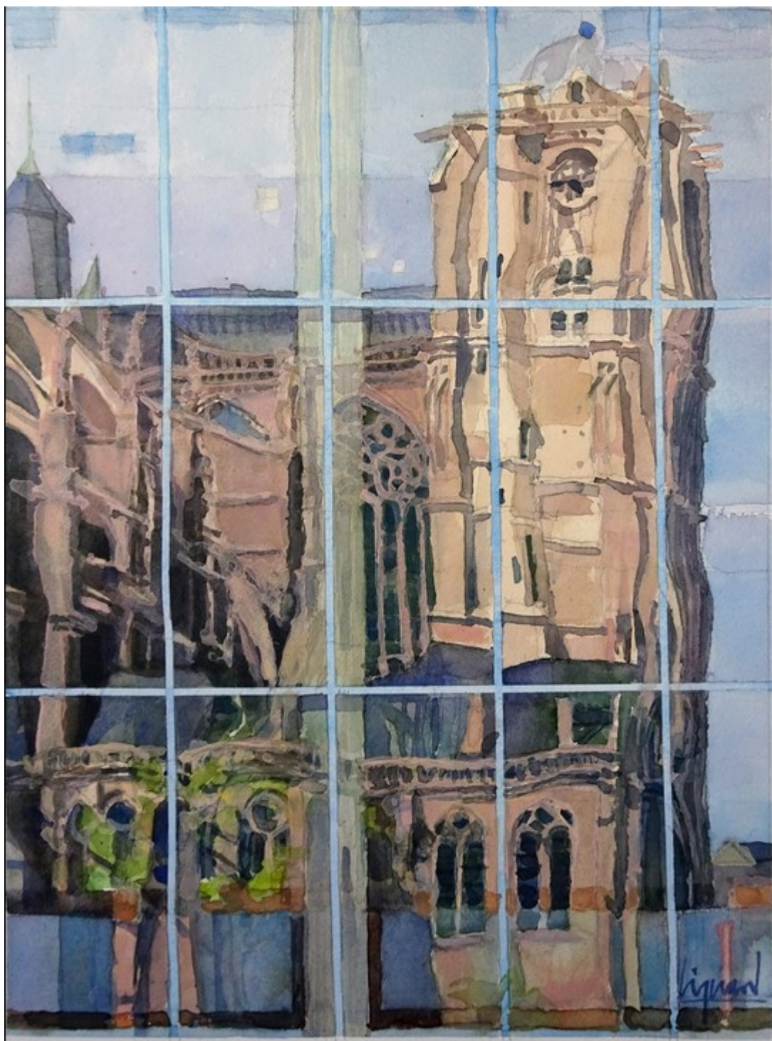
Oeuvre de Jean-Claude Lizerand