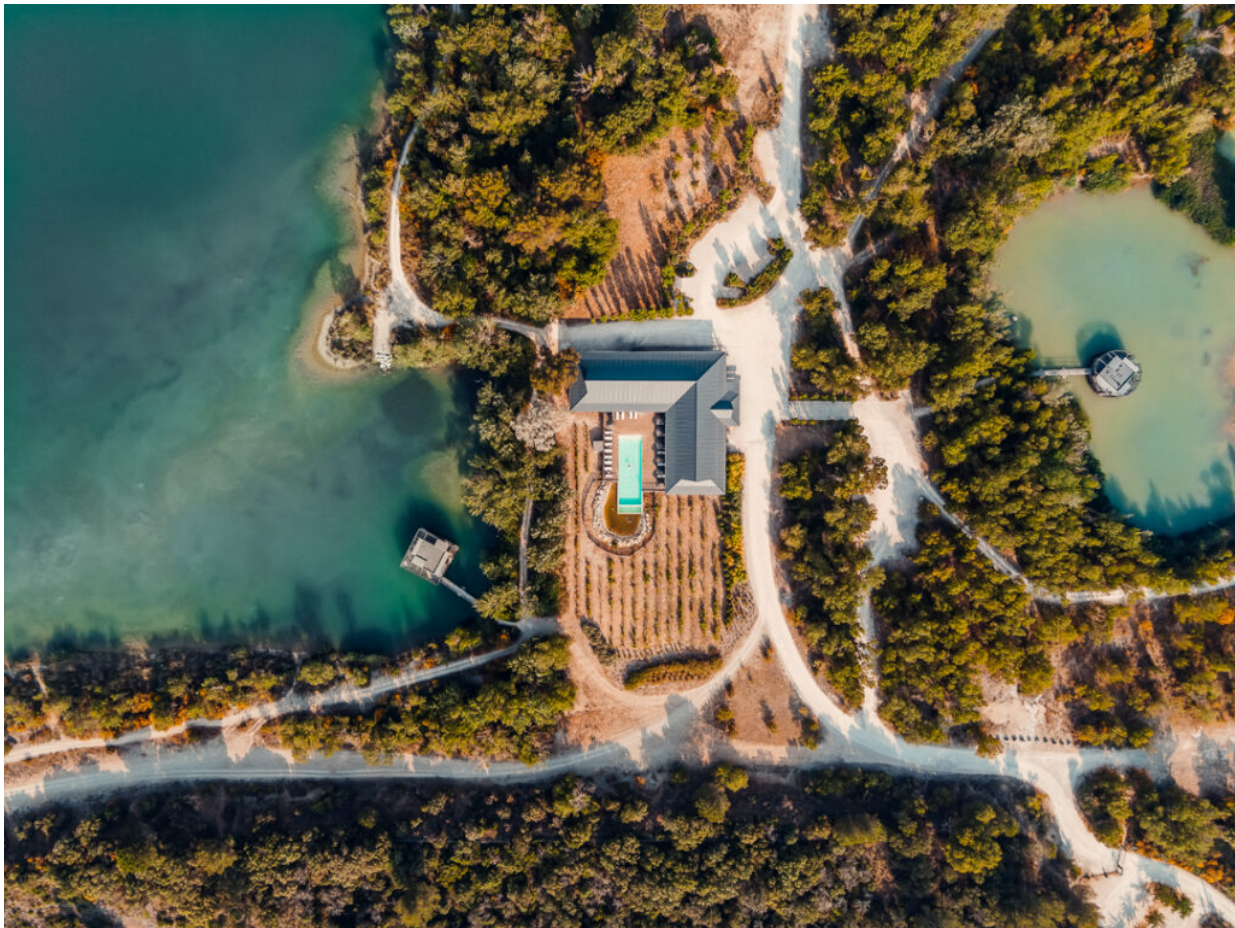
Cabanes des grands cépages à Sorgues