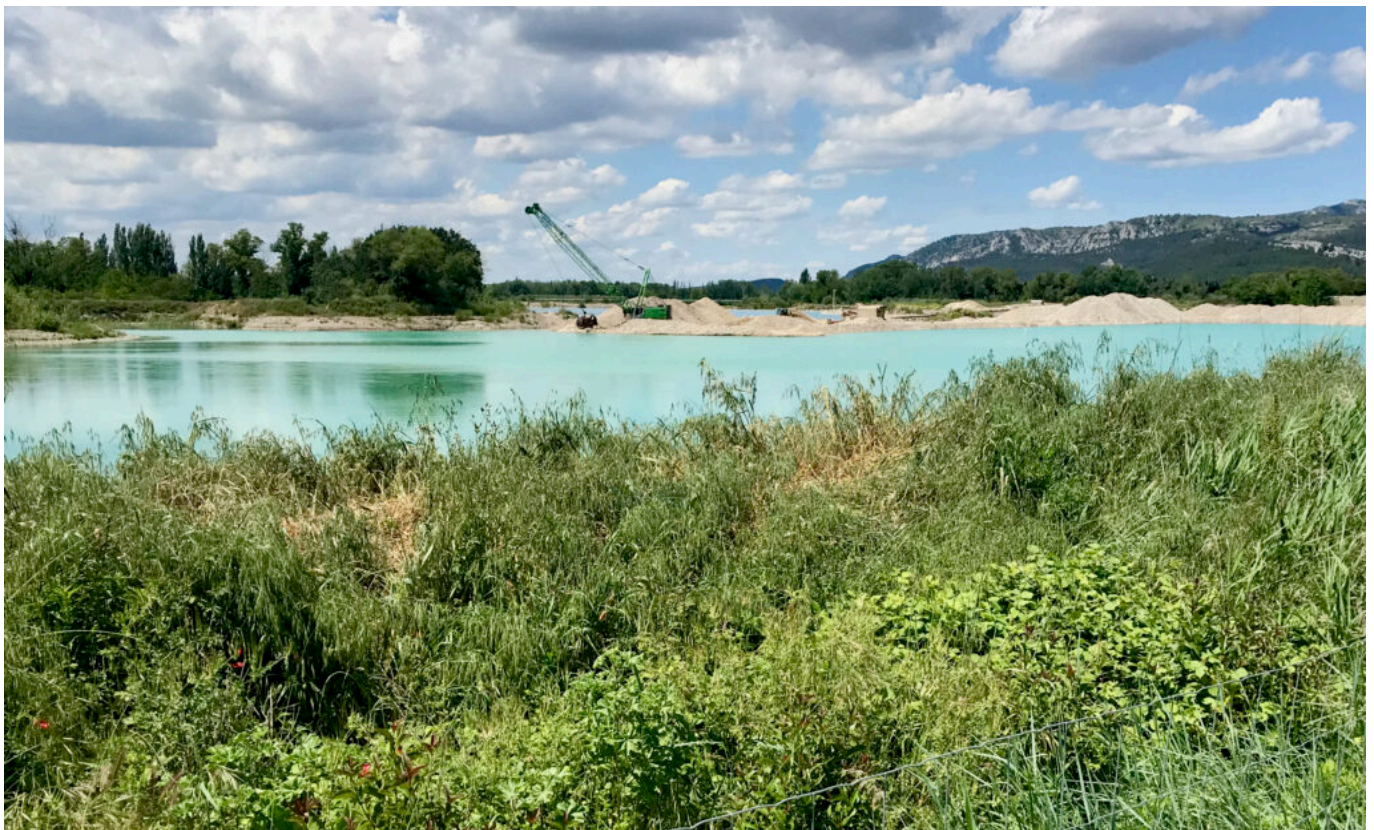
Gravières de Mallemort

L'agence de développement économique Vaucluse Provence Attractivité accompagne la ville de Cheval Blanc dans ce projet qui ressemble, il faut bien le dire, à une course à obstacles.