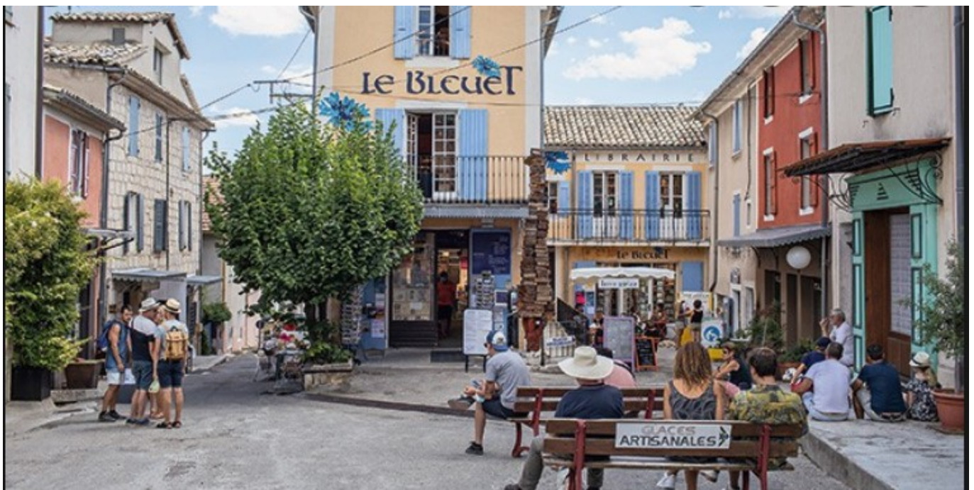
Librairie Le Bleuët à Banon

Le Festival des Oralies, nocturne de contes continue ce jeudi 4 août à 20h. Venez entendre 'L'amour du conte' par le conteur et auteur Jihad Darwiche au gré de 'Sagesse et malices de Nasreddine ; Le fou qui était sage'. Des histoires pour tous les âges pleines de saveur et de sagesse. Les Oralies ont lieu jusqu'au 15 août. Toujours à la Librairie Le Bleuët à Banon.