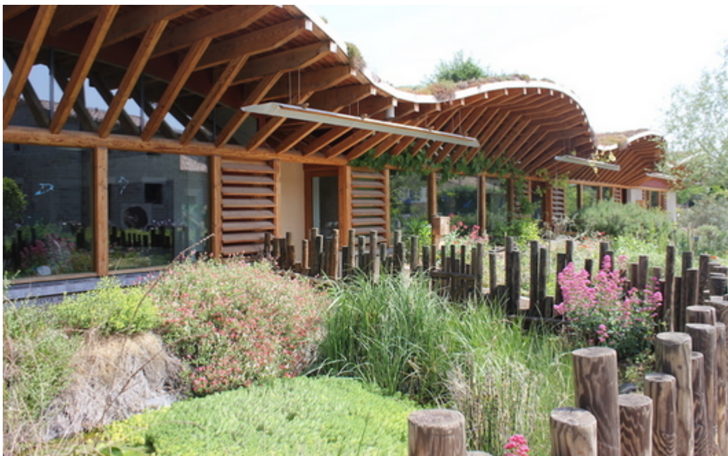
Le naturoptère l »Harmas à Sérignan-du-Comtat