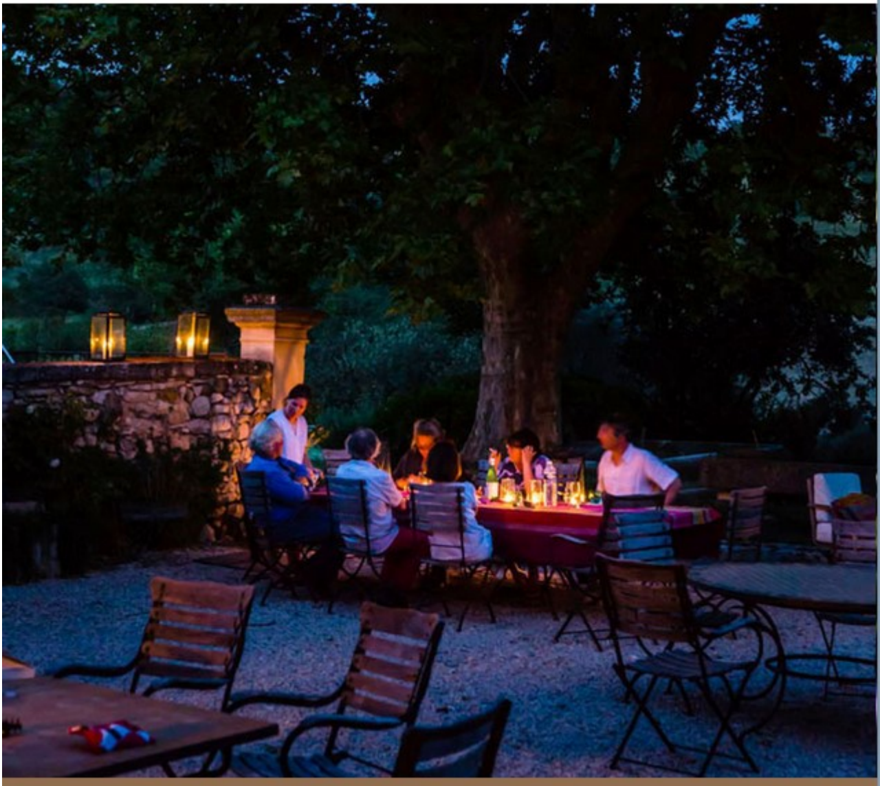
Le Domaine des Davids à Viens