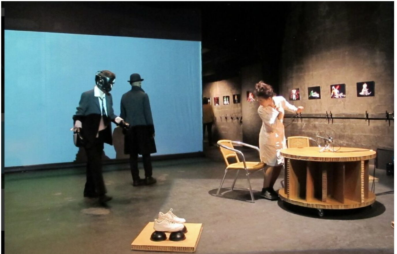
Le volet artistique de Volubilis