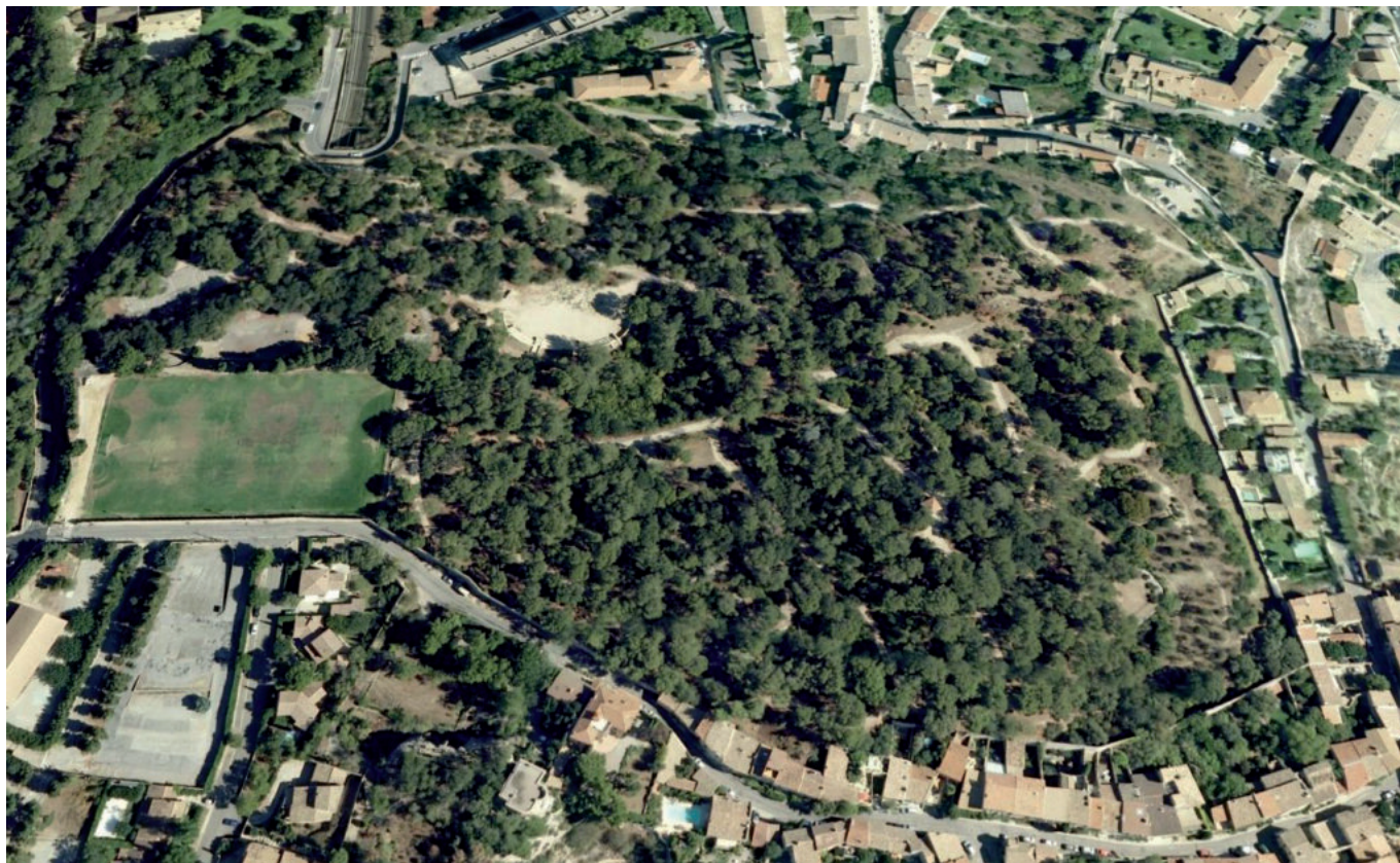
La colline des Mourgues : 7ha de forêt en plein cœur de ville.