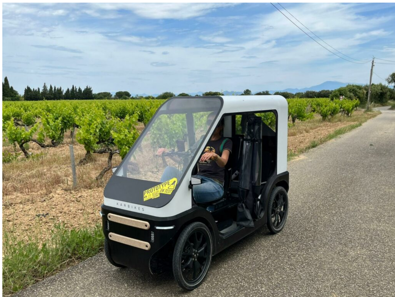
Karbikes, véhicule intermédiaire.

Le karbikes arbore 4 roues et est dévolu aux déplacements urbains et périurbains. A mi-chemin entre le vélo et la voiture, il propose une assistance électrique et nécessite le pédalage. Sa structure fermée protège le conducteur des intempéries. Il peut atteindre les 25km/h. Il est développé à Strasbourg.