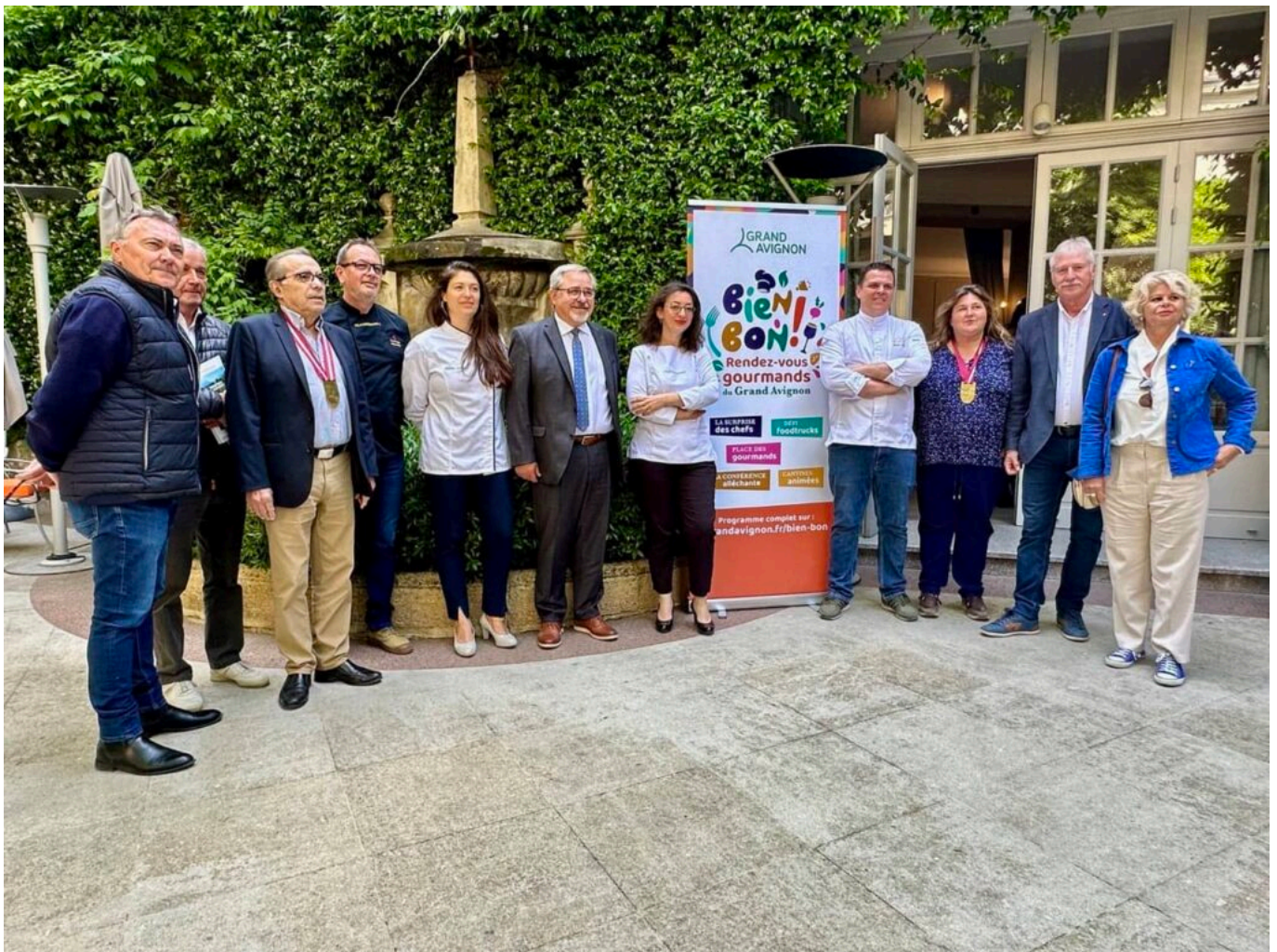
Les acteurs de 'Bien Bon !' lors de la présentation de l'événement.