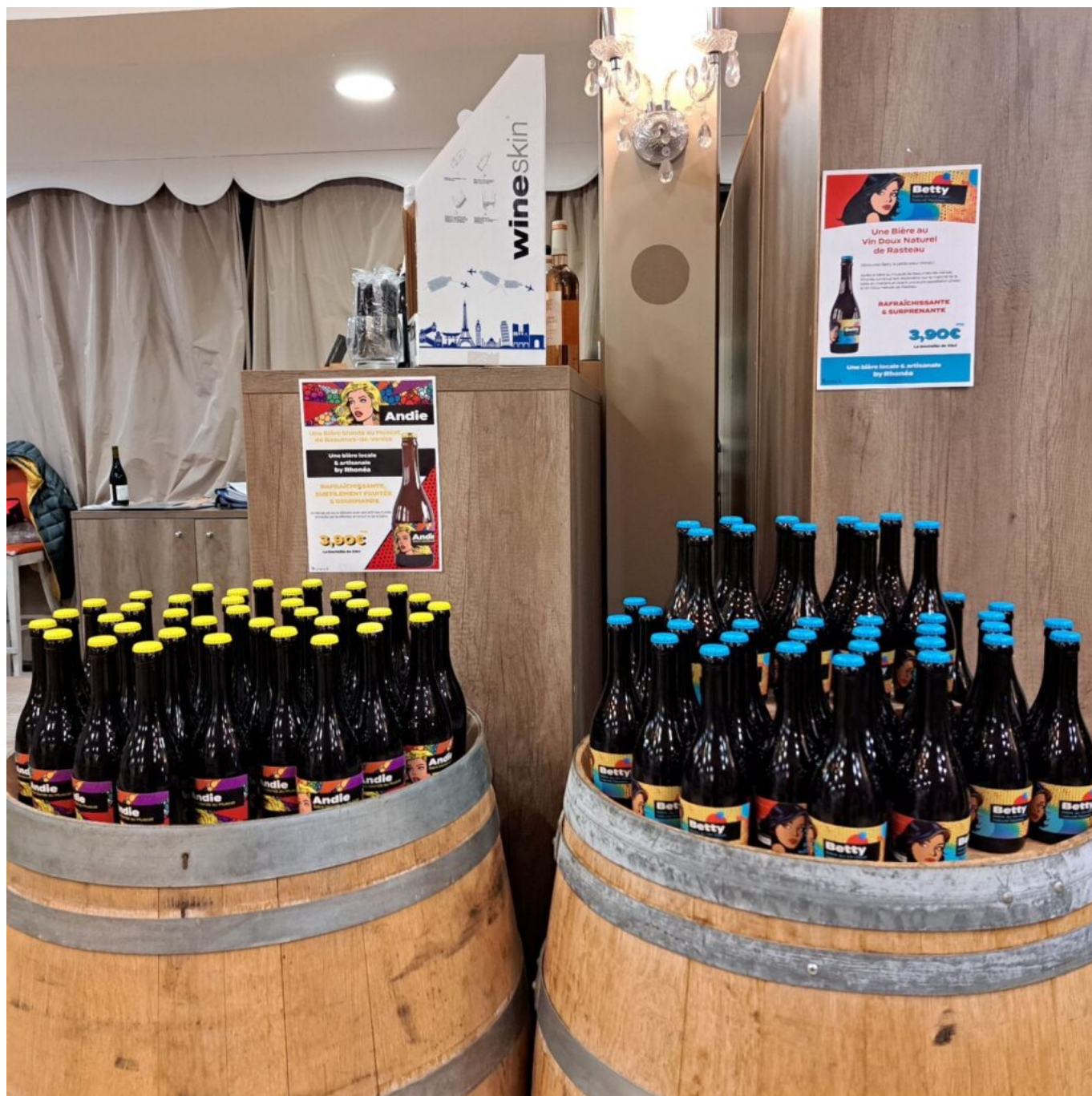
Les bière 'Andie' et 'Betty'.