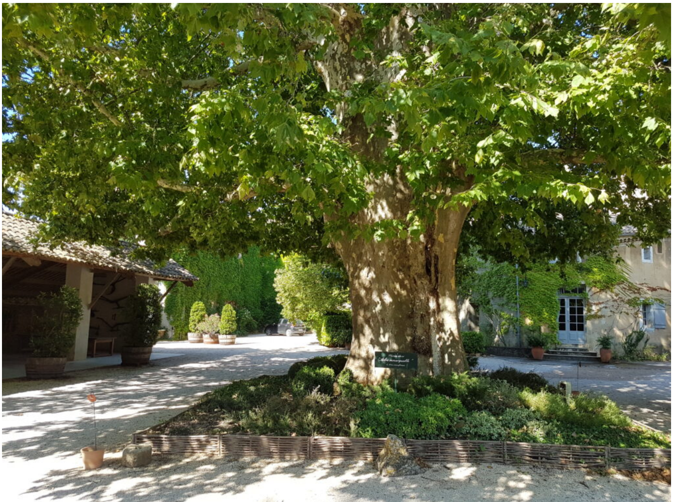
Le fameux platane classé « arbre remarquable. »