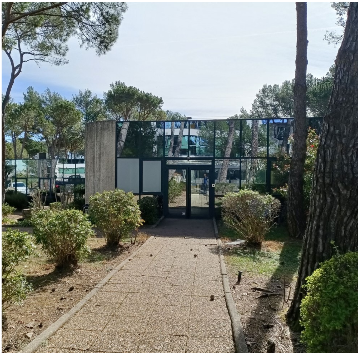
Le site de Sophia-Antipolis.

« L'idée générale, c'est de proposer le plus possible une continuité dans les départements de formation, complète Vincent Belmontet. L'objectif étant d'accompagner au maximum les jeunes dans la poursuite de leurs études afin de les mener vers les étapes les plus hautes dans leur formation. Ainsi, il y a environ