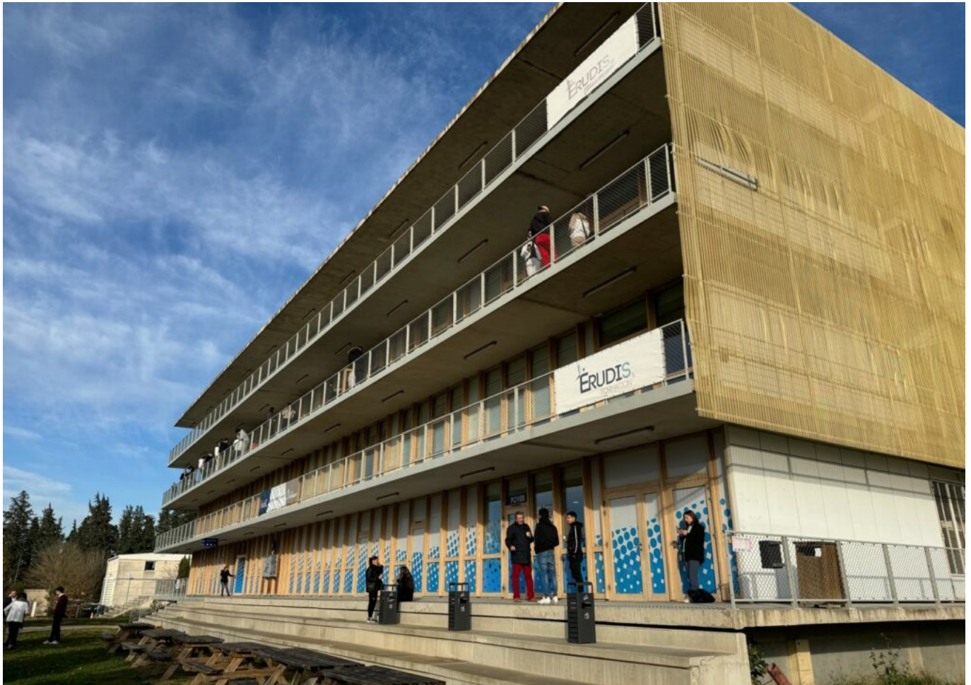
Une partie des locaux actuels situés à Agroparc.

les deux en même temps et faire en sorte que Nextech redevienne la belle école qu'elle avait été. »