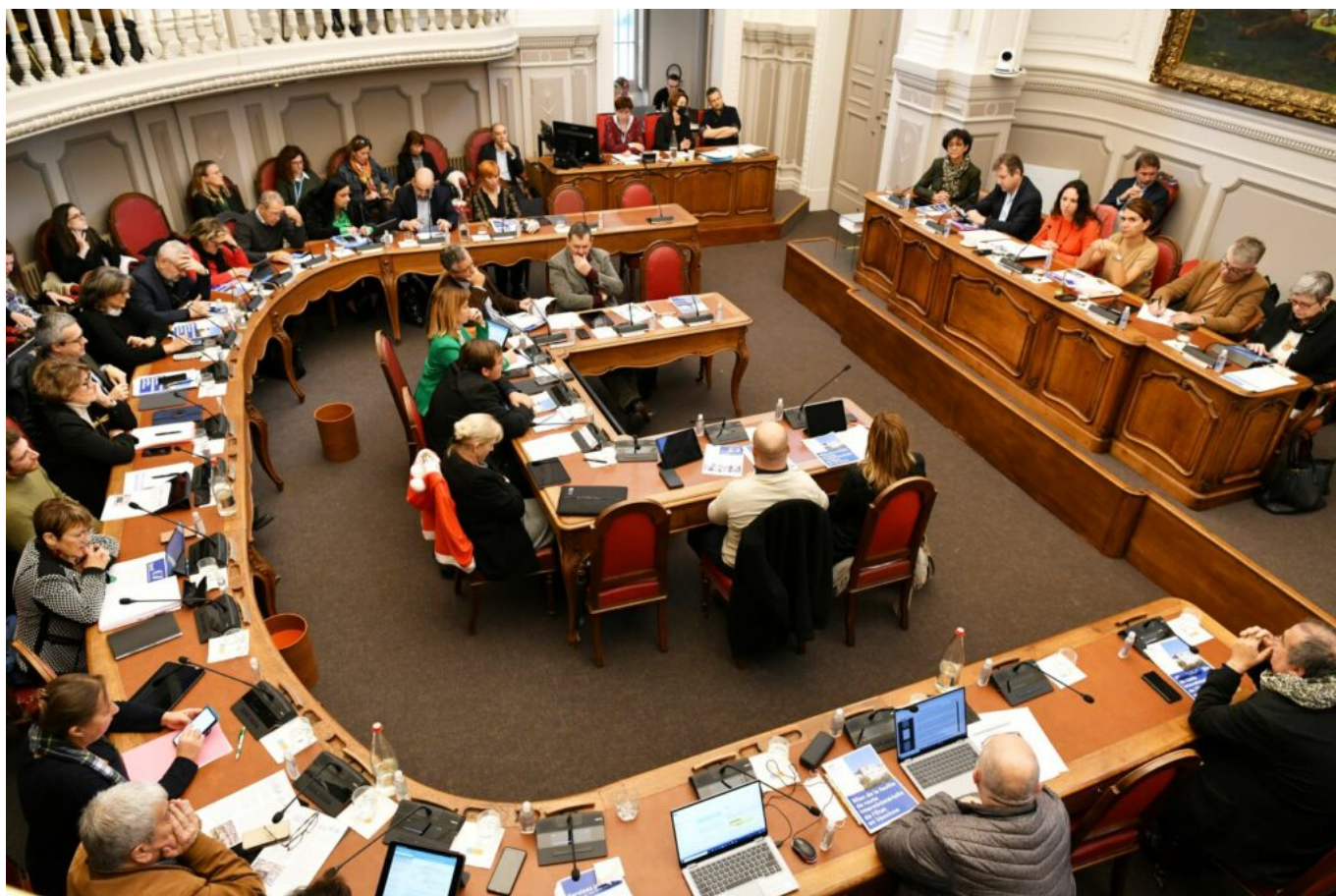
Les conseillers départementaux attentifs à la parole de la représentante de l'Etat en Vaucluse

La préfète continue de détailler sa feuille de route : pour l'éducation, il faut accélérer les efforts, dédoubler les effectifs dans les REP (Réseaux d'éducation prioritaire), pas plus de 24 élèves par classe et aussi offrir une scolarisation inclusive aux enfants handicapés, à ce jour le but de 90 unités d'inclusion est quasiment atteint. Pour lutter contre les déserts médicaux, les structures de soins doivent être démultipliées. Il existe 24 maisons de santé, dans le cadre du Covid, 20 centres de vaccination et de dépistage ont été mis en œuvre.