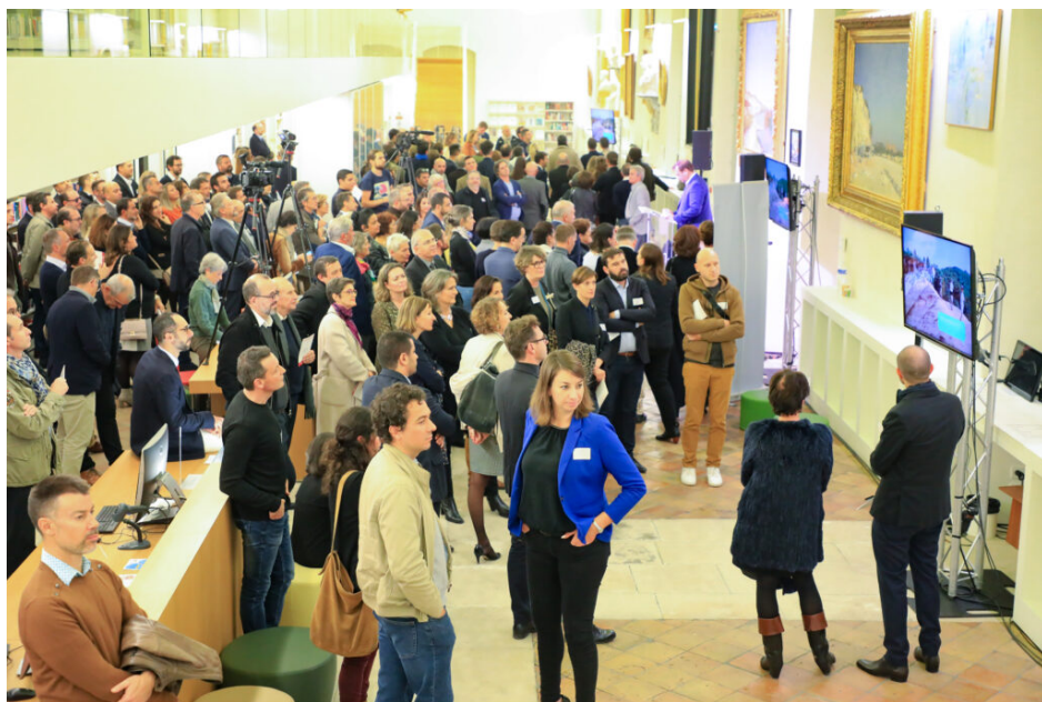
Plus de 200 décideurs locaux étaient réunis à l'Inguimbertaine

graines, des semences, des producteurs de fruits, de légumes, d'herbes aromatiques, des transformateurs, des entreprises d'agro-alimentaire, des centaines d'ingénieurs et de chercheurs en agronomie, une chambre d'agriculture, une université, des paysans, un pôle de compétitivité Innov'Alliance , nous pouvons mutualiser nos laboratoires et aller bien plus loin« .