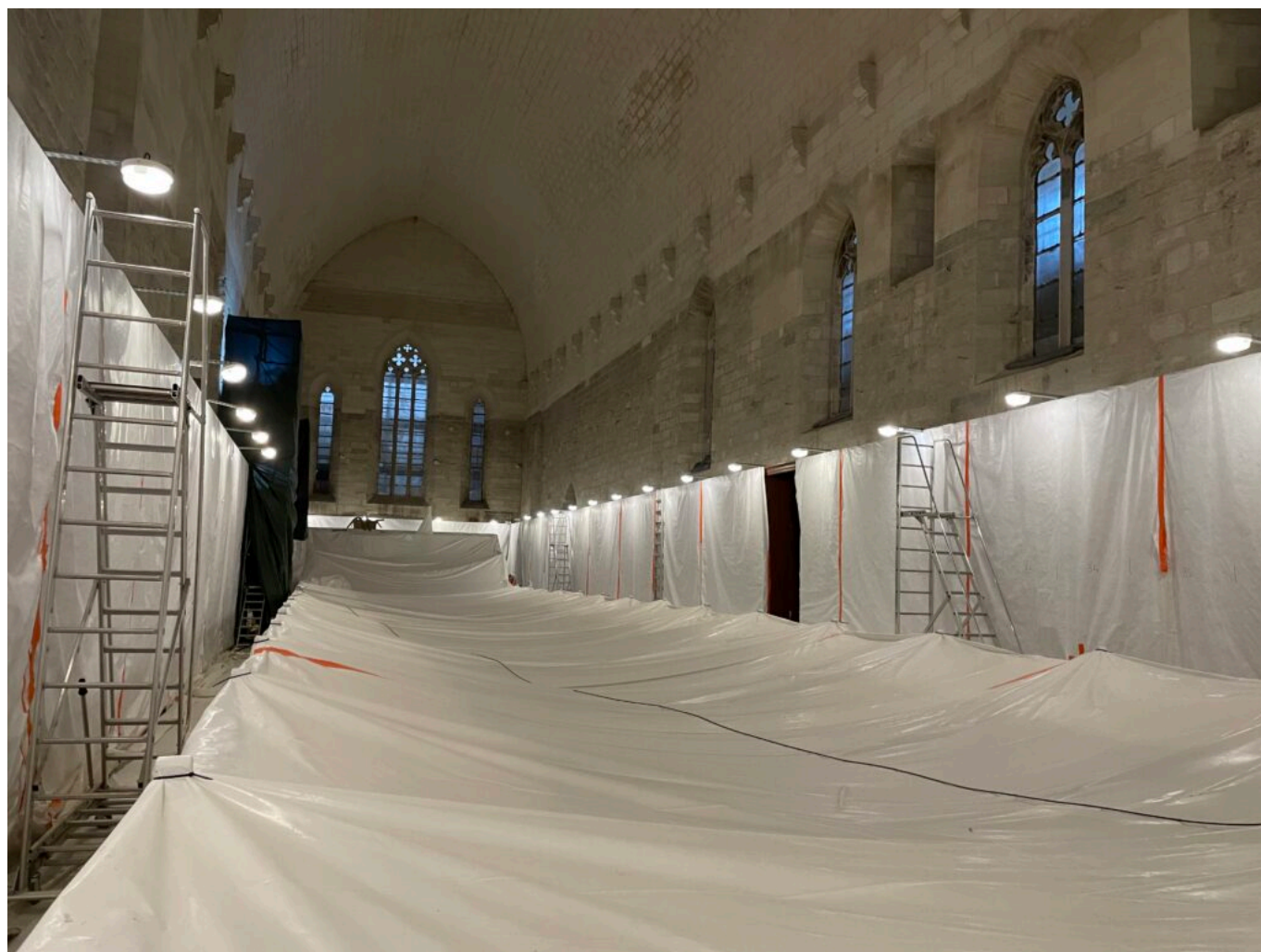
La Chapelle Benoît XII entièrement bâchée