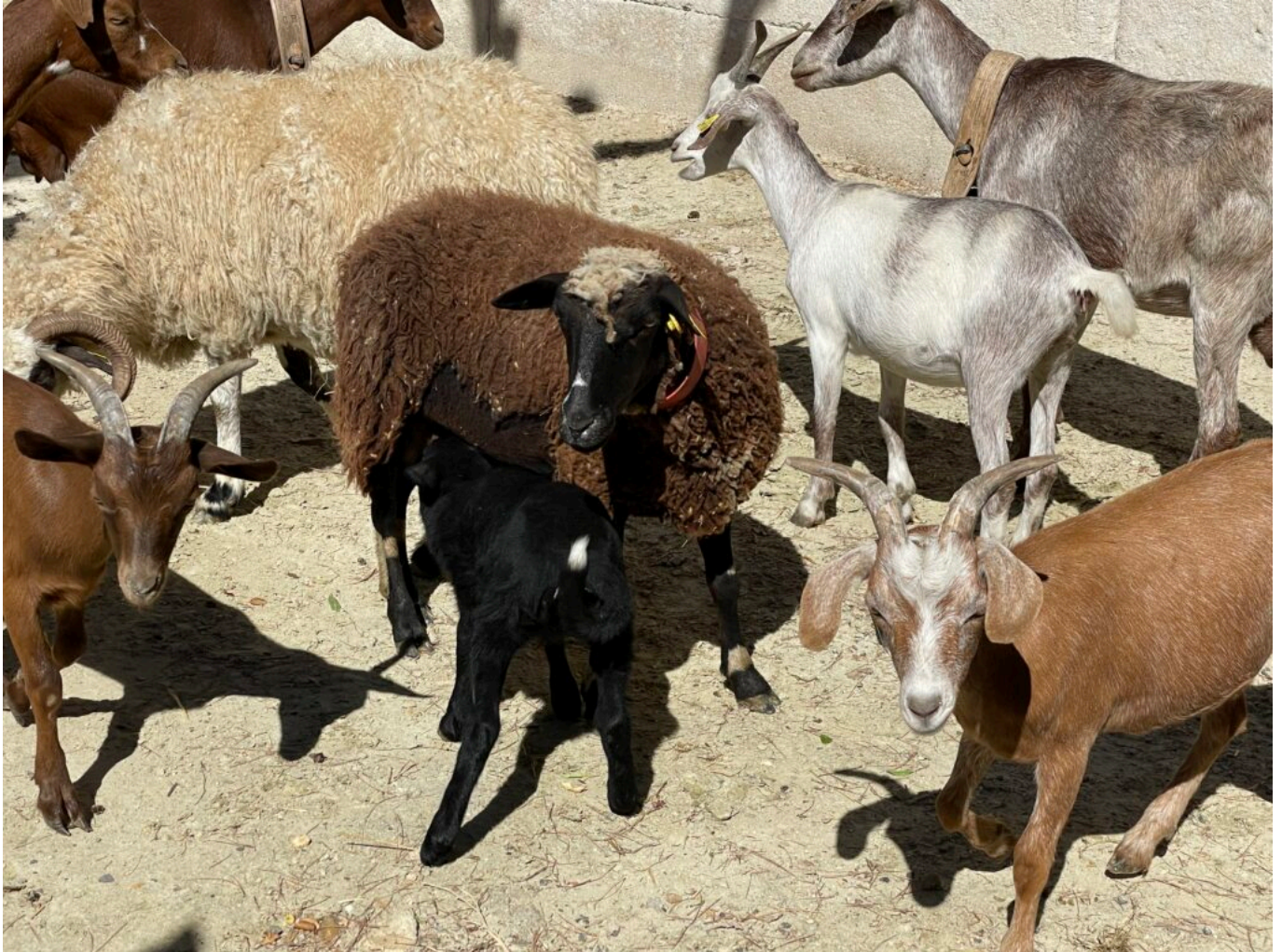
Troupeau d'ovins

l'Assomption, hors offices et cérémonies. Les bergers avec leurs moutons, âne, chèvres et chien chemineront dans les rues et les calades. Il sera tout aussi possible de profiter de ces dernières belles journées de l'été pour découvrir les sentiers des plantes, des peintres et le patrimoine bâti.