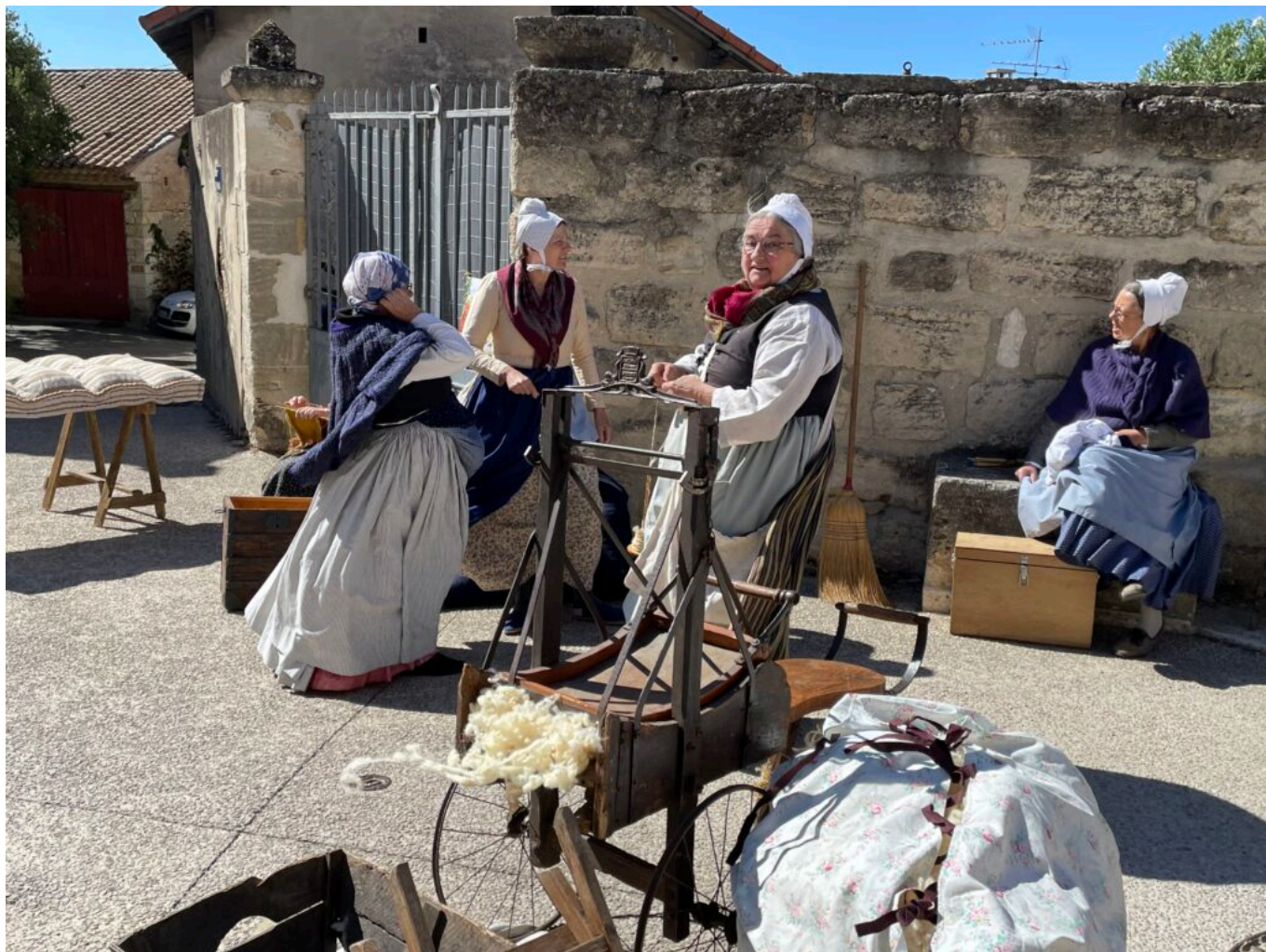
Cardage de la laine, fabrication de matelas

17h30-18h30 Théâtre Le lavoir, œuvre de Dominique Durvin et Hélène Prévost sur une libre adaptation de Bertrand Beillot, au lavoir.