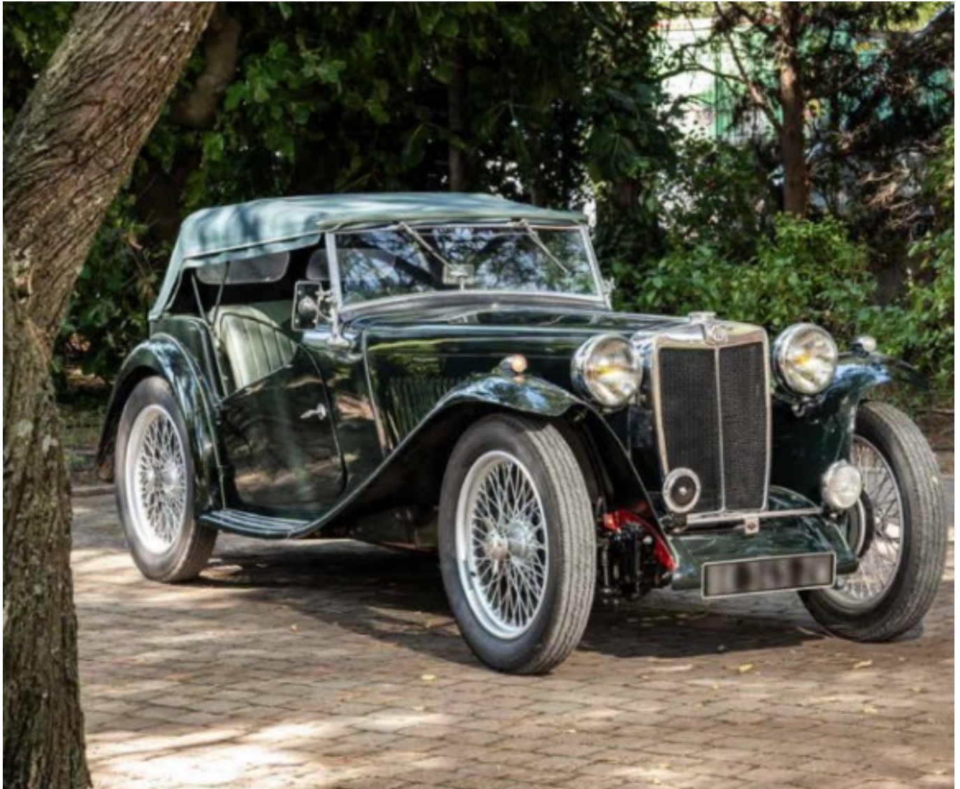
MG TC 1947