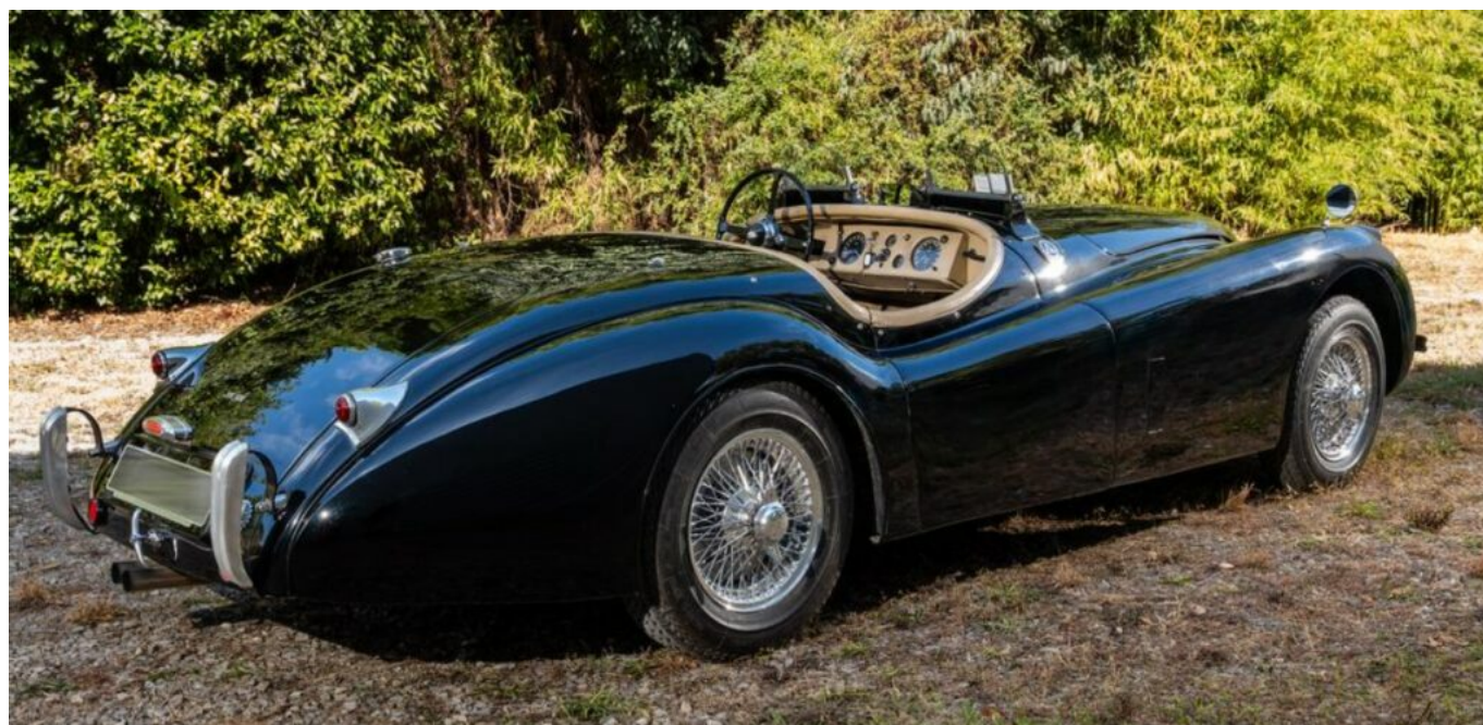
Jaguar XK 120 de 1953

Parmi ces pièces d'exception, une Alfa Romeo 1900 Super Sprint Touring Superleggera de 1954 attire déjà les regards. Carrossée par Touring, rare -à peine 854 exemplaires produits- et éligible au Mille Miglia, elle symbolise la quintessence du style italien : finesse des lignes, intérieur vert amande et histoire jalonnée de concours d'élégance.