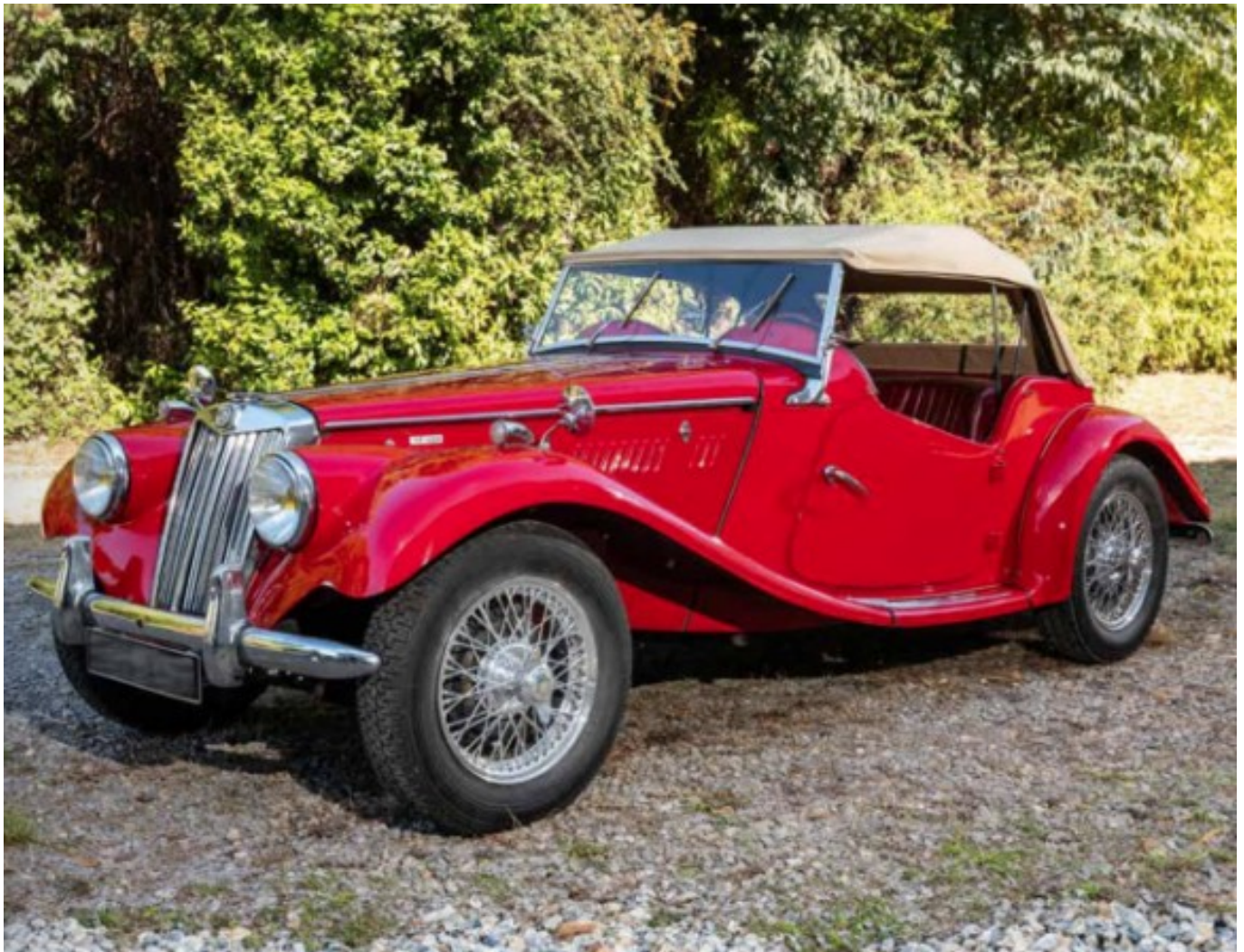
MG TF 1955

Face aux classiques britanniques, l'Italie et l'Allemagne déploient leurs armes. La Ferrari 308 GTSi Quattrovalvole et la rarissime Testarossa Monospecchio incarnent le panache du cheval cabré : lignes signées Pininfarina, mécaniques sculpturales, et cette aura inimitable des sportives conçues sous le regard d'Enzo Ferrari.