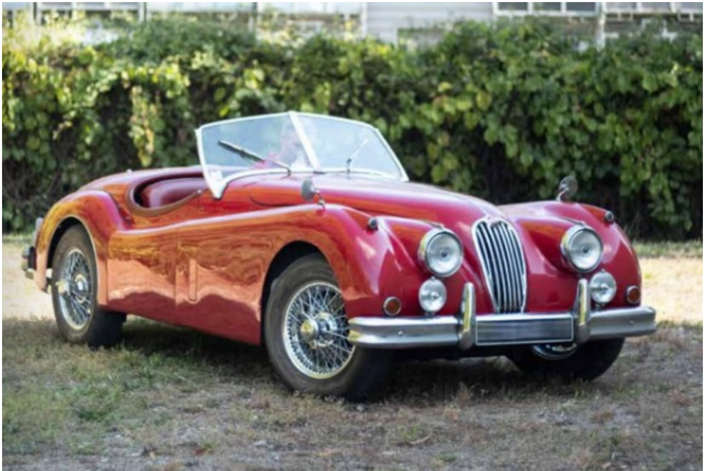
Jaguar XK 140 de 1955

deviendra successivement propriétaire des concessions Mercedes VP et VI de Nîmes et Montpellier. Passionné d'automobiles il a fait l'acquisition de véhicules de collection au fur et à mesure des années et des opportunités qui s'offraient à lui. Acquisitions qui se faisaient auprès de particuliers gardois ou vauclusiens, où lors de ventes publiques. Son amour des belles mécaniques le conduira à édifier un bâtiment pour abriter sa collection. »