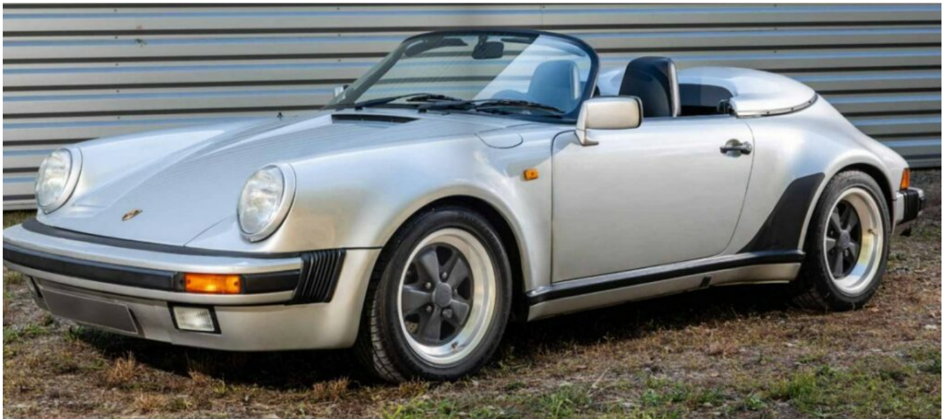
Porsche 911 Carrera