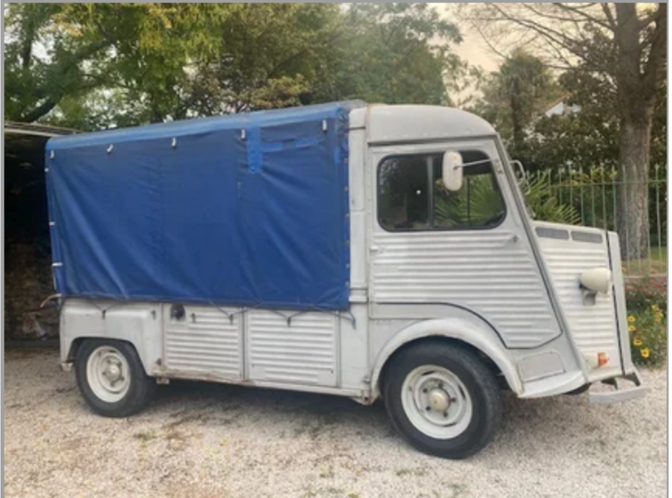
Citroën pick up d'avril 1978