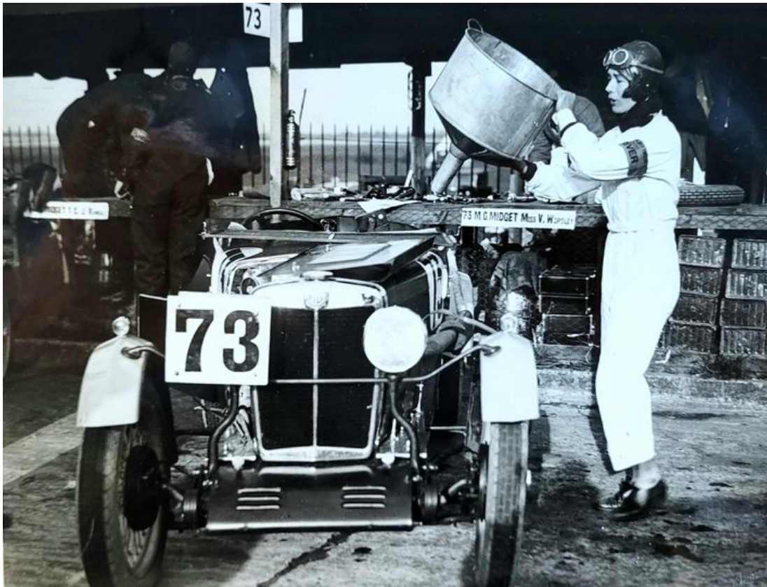
Une des photos qui seront exposées à Motor Passion.

Cabriolets, coupés, berlines, limousines, voitures de rêve et de légende, Jaguar Type E, Maserati, Lotus, Rolls-Royce, Traction avant, Mini, 4CV, BMW, Lamborghini, Ferrari, Buick, Citroën SM, Porsche, trôneront au Parc des Expositions. Ainsi que l'Alpine bleue A 110 de l'EDSR (Escadron départemental de la Sécurité Routière de la Gendarmerie de Vaucluse). « Un hommage sera rendu aussi à l'Autodrome d'Istres-Miramas (Bouches-du-Rhône), explique Florent Bourges, commissaire d'exposition. Créé en 1924 où une Simca 'Ariane 4' a parcouru 200 000 km à 100km/h en 5 mois, un record du monde d'endurance. Cette Ariane historique sera exposée dans le Hall A. Comme la 'Djelmo' qui a battu le record de vitesse de 257km/h sur ce même anneau des bords de l'Etang de Berre il y a 100 ans. » Avignon Motor Passion (22-24 mars), c'est aussi le paradis des pièces détachées, des voitures radiocommandées et des miniatures.