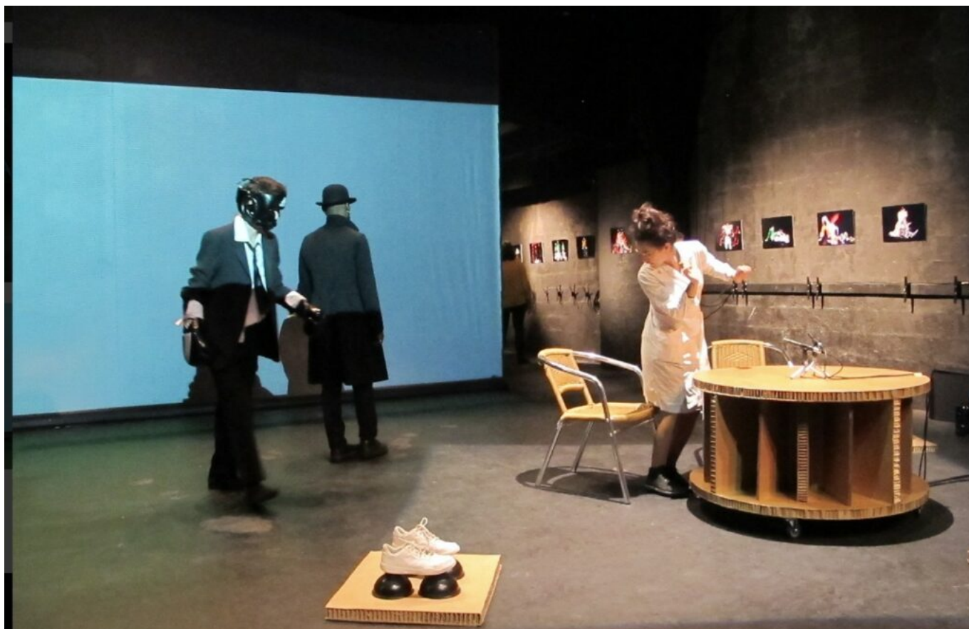
Le volet artistique de Volubilis

Jeudi 27 et vendredi 28 novembre 2025. Avignon. Public concerné architectes, urbanistes, paysagistes, responsables techniques, enseignants et élus. L'intégralité du programme de la formation-colloque ici . Tous les renseignements auprès de Volubilis . 8, rue Frédéric Mistral à Avignon 04 32 76 24 66. Mireille Hurlin