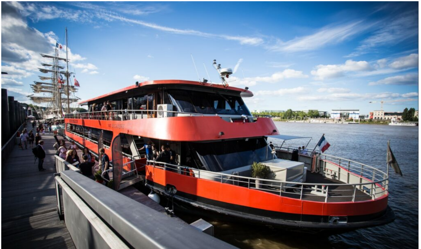
Le Sicambre à Bordeaux