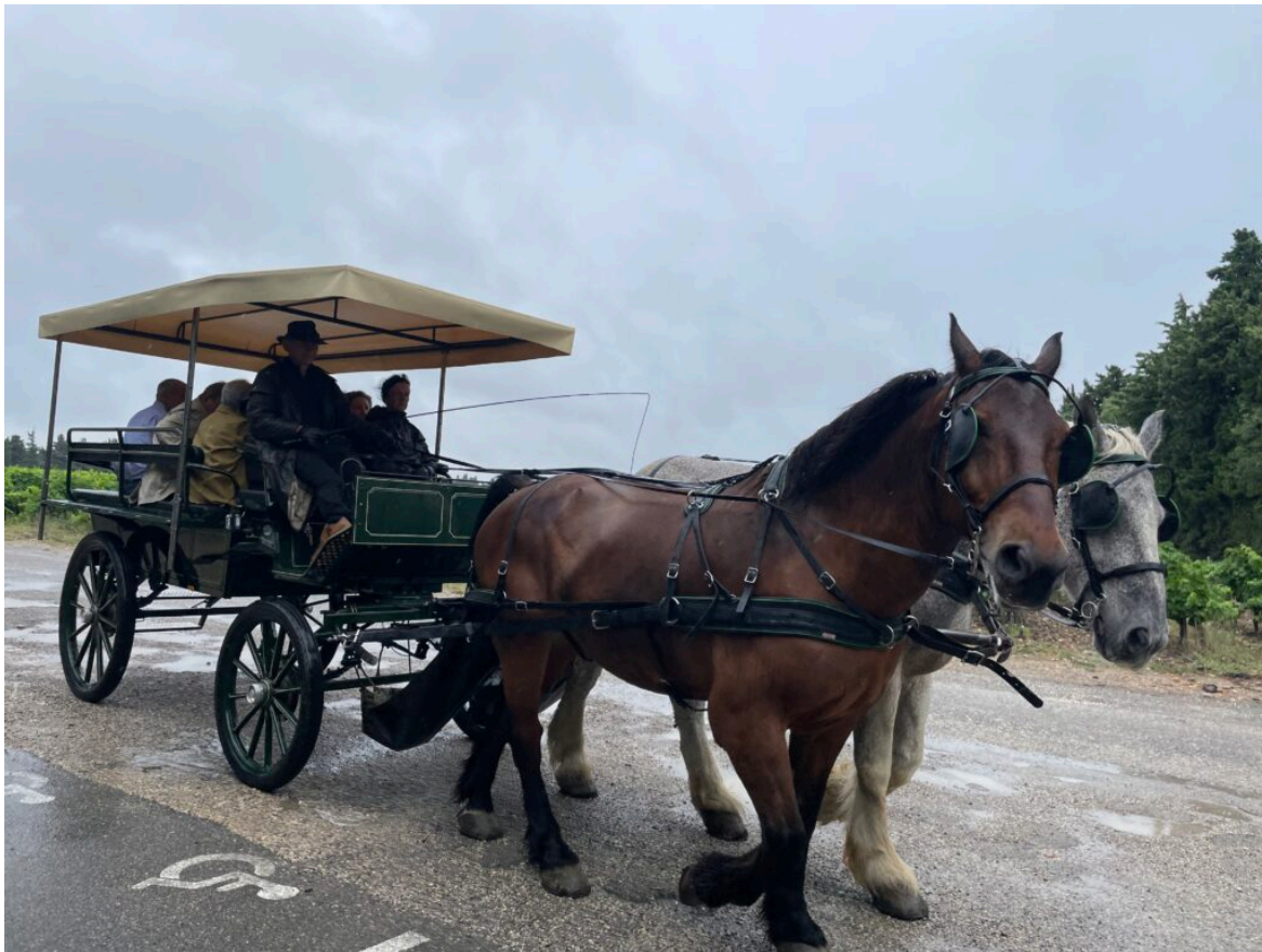
Les chevaux Vick et Vanda tractent les invités jusqu'à l'accueil, à l'abri de l'orage