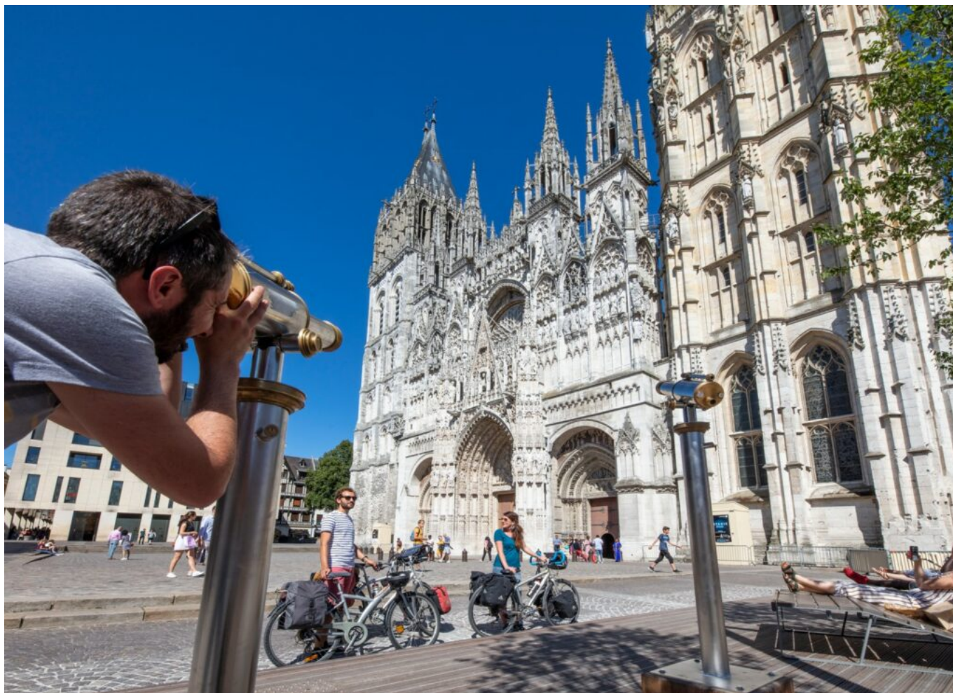
La cathédrale Notre-Dame-de-Rouen se situe en plein cœur de la capitale normande.

C'est ensuite dans un environnement pittoresque qu'évolue les voyageurs. Ils pédalent avec les paysages de falaises dominant la Seine comme décor. Cette étape conduit au village de Poses, ancienne cité batelière dont l'histoire se découvre au Musée de la Batellerie. Avant de rejoindre Rouen, Pont-de-l'Arche avec son abbaye de Bonport ainsi qu'Elbeuf et sa Fabrique des Savoirs sont à découvrir au fil des kilomètres. La traversée de la forêt de La Londe Rouvray sonne l'arrivée dans la capitale normande remplie d'histoire où il fait bon déambuler dans son cœur médiéval préservé.