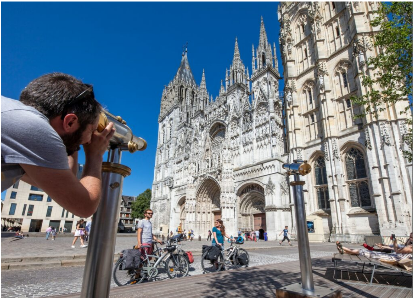
La cathédrale Notre-Dame-de-Rouen se situe en plein cœur de la capitale normande.

C'est ensuite dans un environnement pittoresque qu'évolue les voyageurs. Ils pédalent avec les paysages de falaises dominant la Seine comme décor. Cette étape conduit au village de Poses, ancienne cité batelière dont l'histoire se découvre au Musée de la Batellerie. Avant de rejoindre Rouen, Pont-de-l'Arche avec son abbaye de Bonport ainsi qu'Elbeuf et sa Fabrique des Savoirs sont à découvrir au fil des kilomètres. La traversée de la forêt de La Londe Rouvray sonne l'arrivée dans la capitale normande remplie d'histoire où il fait bon déambuler dans son cœur médiéval préservé.