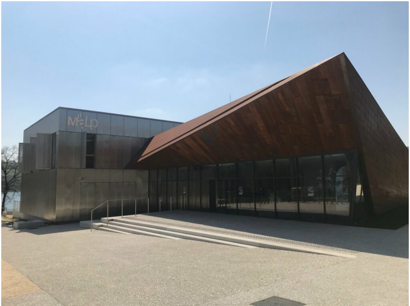
Le Malp © Caroline Thermozy-Liaudy