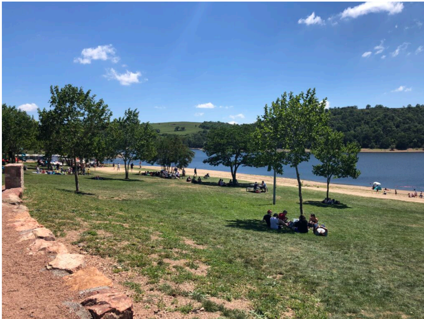
Le lac de Villers