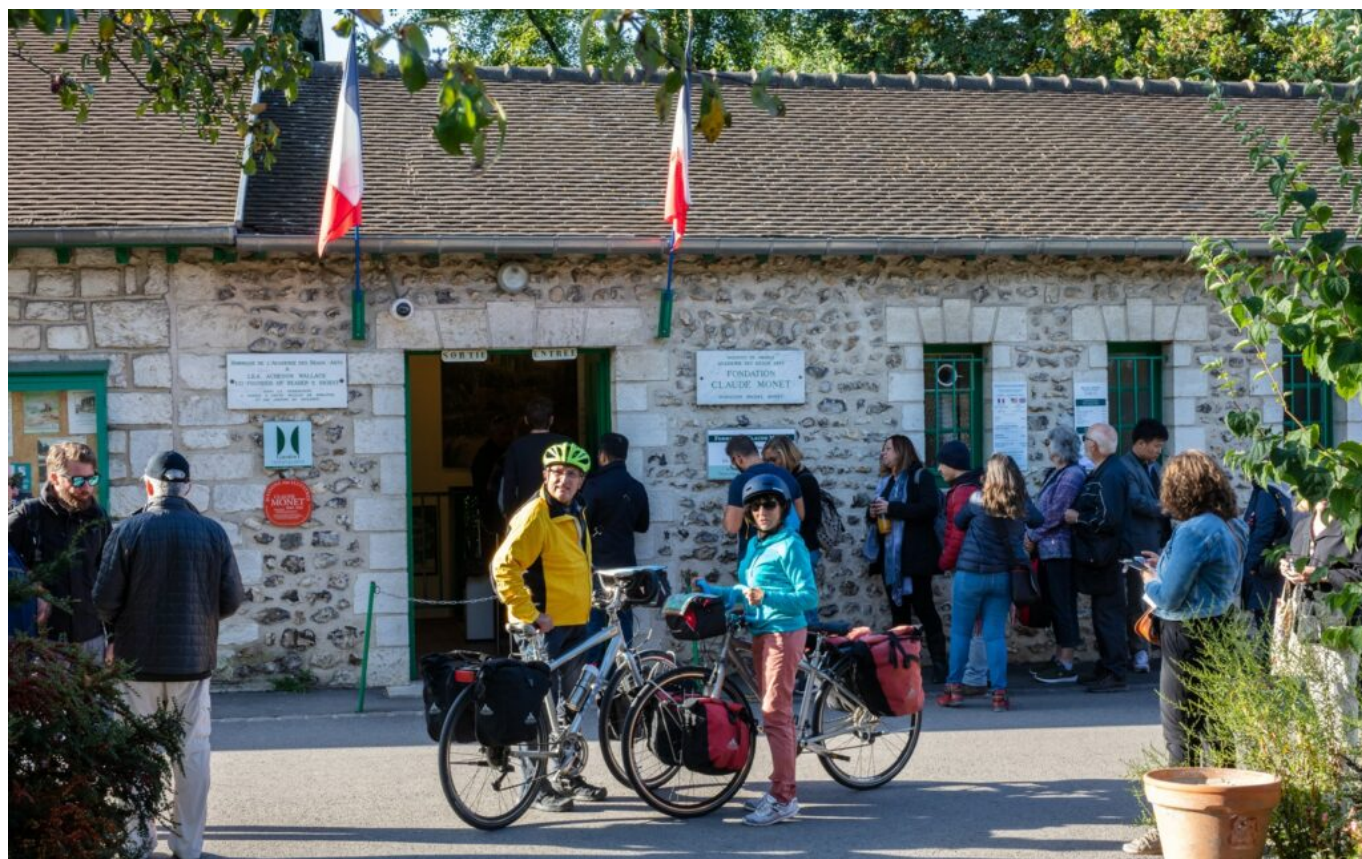
Les cyclistes roulent sur les traces de Claude Monet avec Giverny comme point d'étape.

Des paysages que les quinze territoires engagés dans cette démarche veulent mettre en avant pour faire rayonner le patrimoine culturel, naturel, historique ou encore industriel de la vallée de la Seine. Et ça fonctionne : la Seine à vélo a été récemment classée parmi les 25 destinations incontournables en 2022 par National Geographic et figure dans les 52 destinations à visiter en 2022 par New York Times.