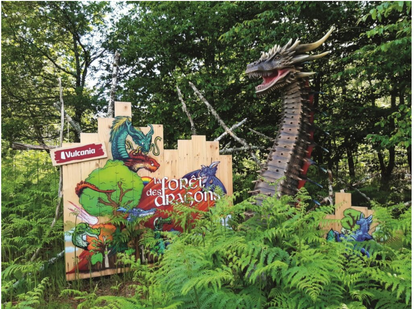
Vulcania, la forêt des dragons

impacts du changement climatique, Vulcania s'intéresse à tous les phénomènes naturels de la planète et aux croyances véhiculées à travers les siècles. En parcourant la Forêt des dragons, huit légendes vous seront ainsi contées.