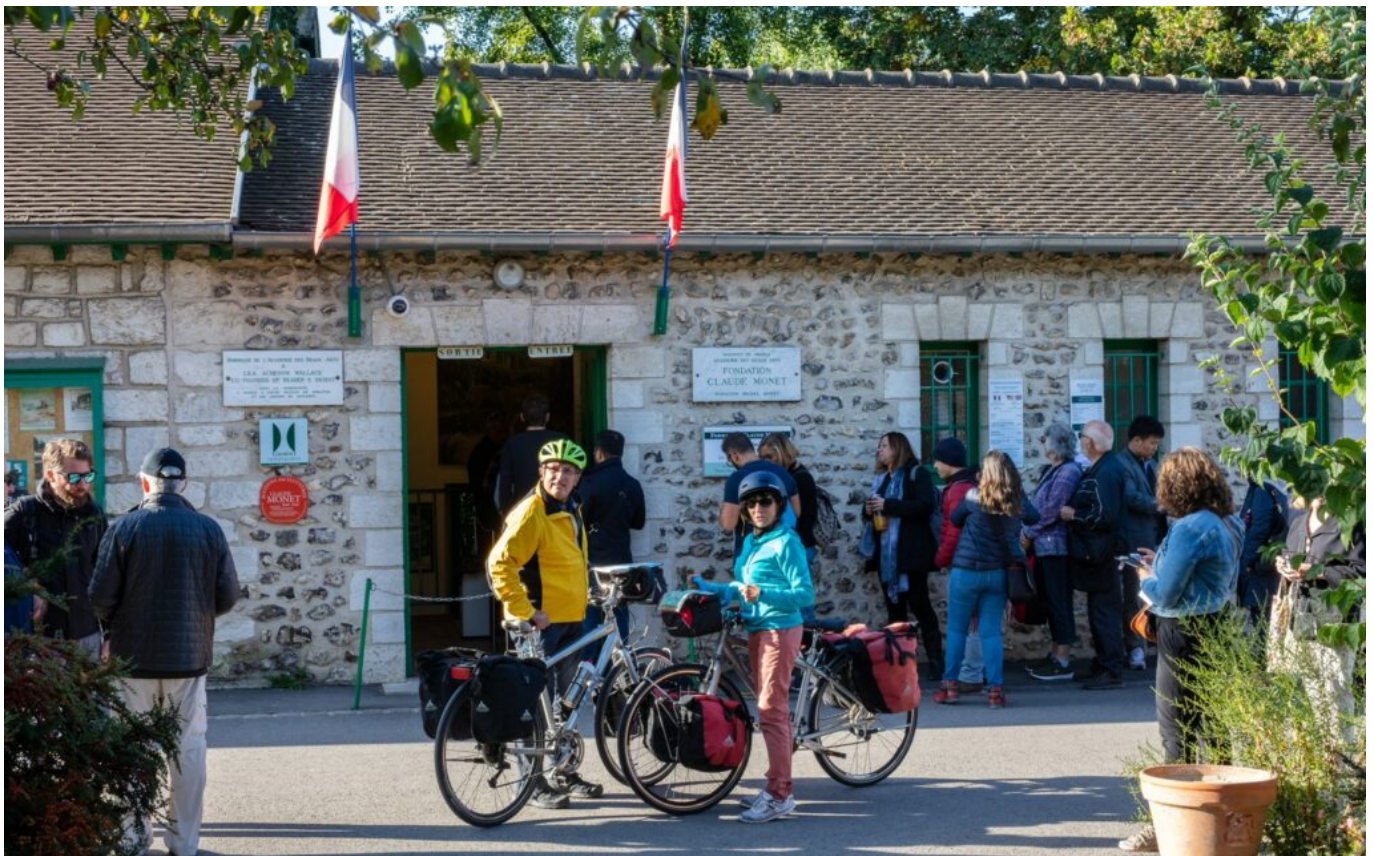
Les cyclistes roulent sur les traces de Claude Monet avec Giverny comme point d'étape.

Des paysages que les quinze territoires engagés dans cette démarche veulent mettre en avant pour faire rayonner le patrimoine culturel, naturel, historique ou encore industriel de la vallée de la Seine. Et ça fonctionne : la Seine à vélo a été récemment classée parmi les 25 destinations incontournables en 2022 par National Geographic et figure dans les 52 destinations à visiter en 2022 par New York Times.