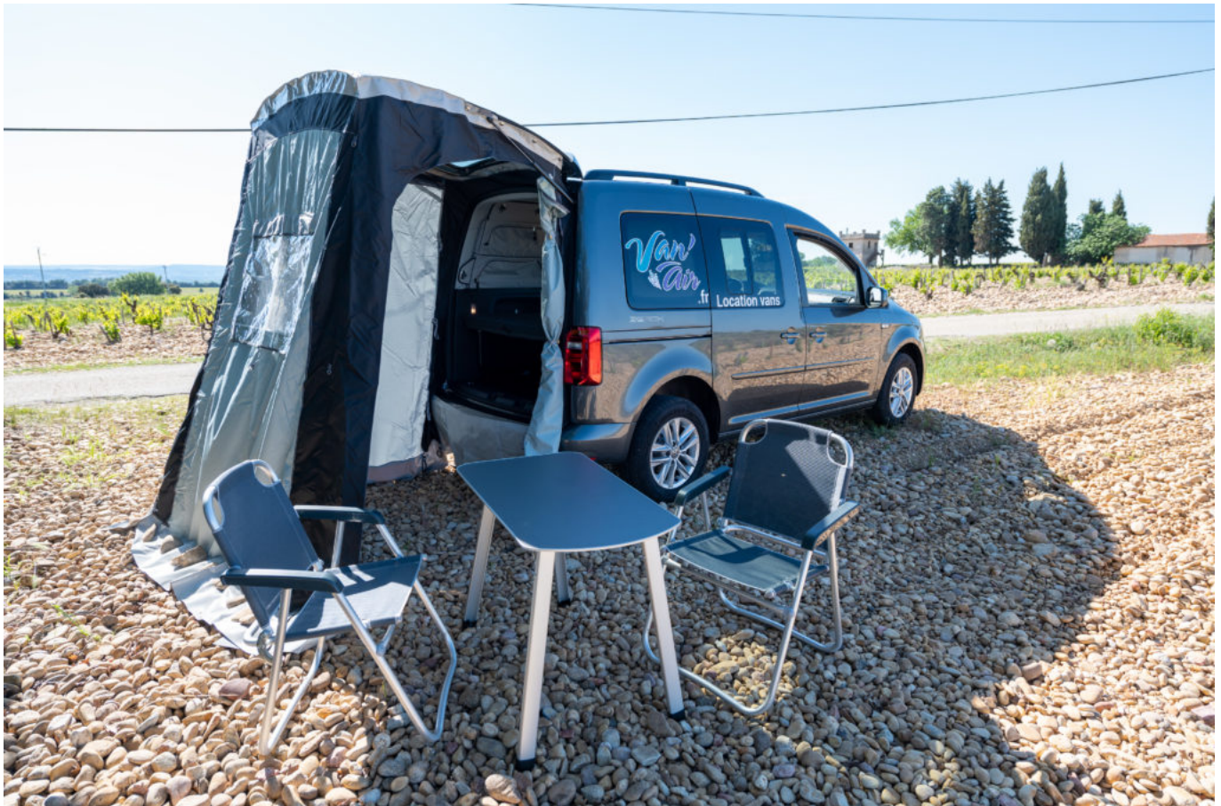
Le Caddy Beach avec une tente de hayon.