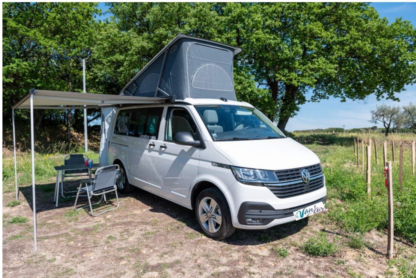
Le 'California' avec le toit relevable.