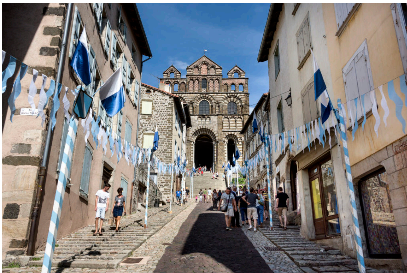
La cathédrale Notre-Dame-du-Puy-en-Velay