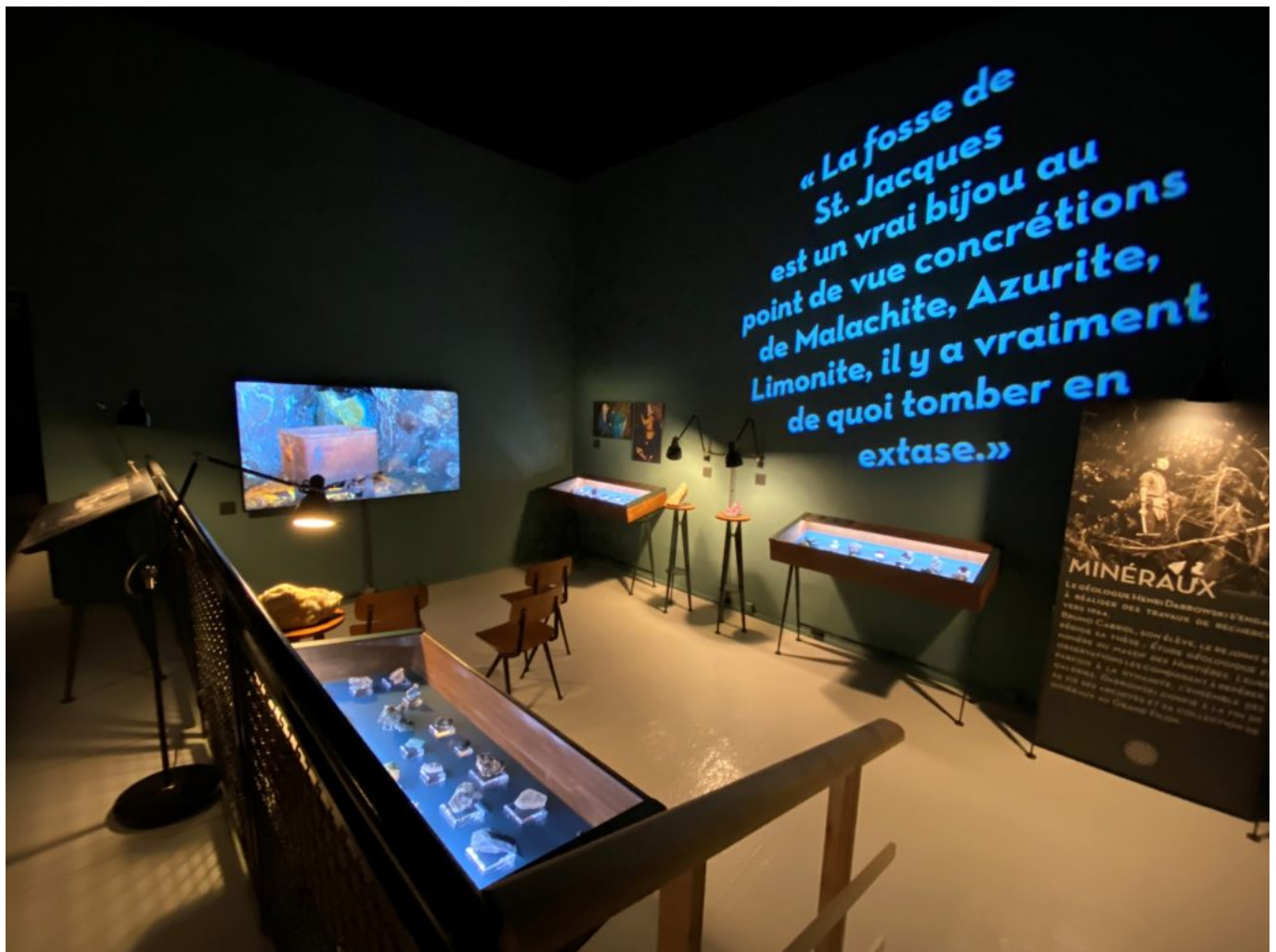
Le musée du fer du Grand Filon bénéficie d'une nouvelle scénographie. Musée du fer Grand Filon © Matthieu Challier

des vestiges de transformation du fer dès le IV e siècle –, ce massif polymétallique est d'abord prisé pour son cuivre et son plomb argentifère. Il faudra attendre le Moyen Âge et l'augmentation du besoin en armes blanches pour voir le fer prendre son essor. La spécialisation de la Basse-Maurienne dans l'exploitation et la transformation de ce minerai s'opère au XVI e siècle avec l'arrivée de métallurgistes italiens qui importent la technique du haut-fourneau "à la bergamasque". Le territoire valorise alors ses ressources en bois et la force hydraulique pour produire un acier de qualité.