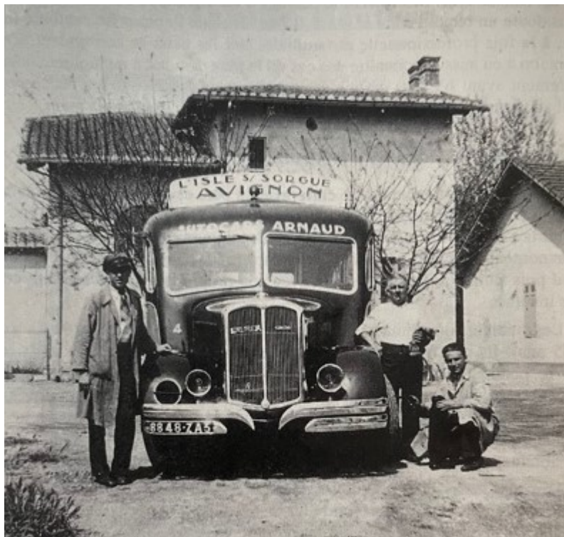
Les Autocars Arnaud à l'Isle-sur-la-Sorgue en 1938.

En tout l'entreprise totalise 150 véhicules dont une quinzaine dédiée aux transports de proximité. On voit ainsi des bus Arnaud qui irriguent les transports urbains de Sorgues, Châteaurenard et dans les agglomérations du Grand Avignon et de Carpentras (Cove).