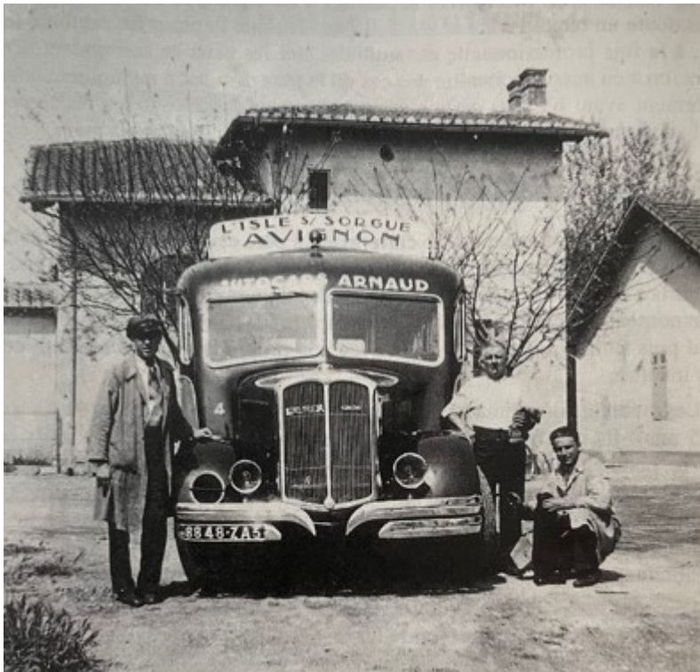
Les Autocars Arnaud à l'Isle-sur-la-Sorgue en 1938.

En tout l'entreprise totalise 150 véhicules dont une quinzaine dédiée aux transports de proximité. On voit ainsi des bus Arnaud qui irriguent les transports urbains de Sorgues, Châteaurenard et dans les agglomérations du Grand Avignon et de Carpentras (Cove).