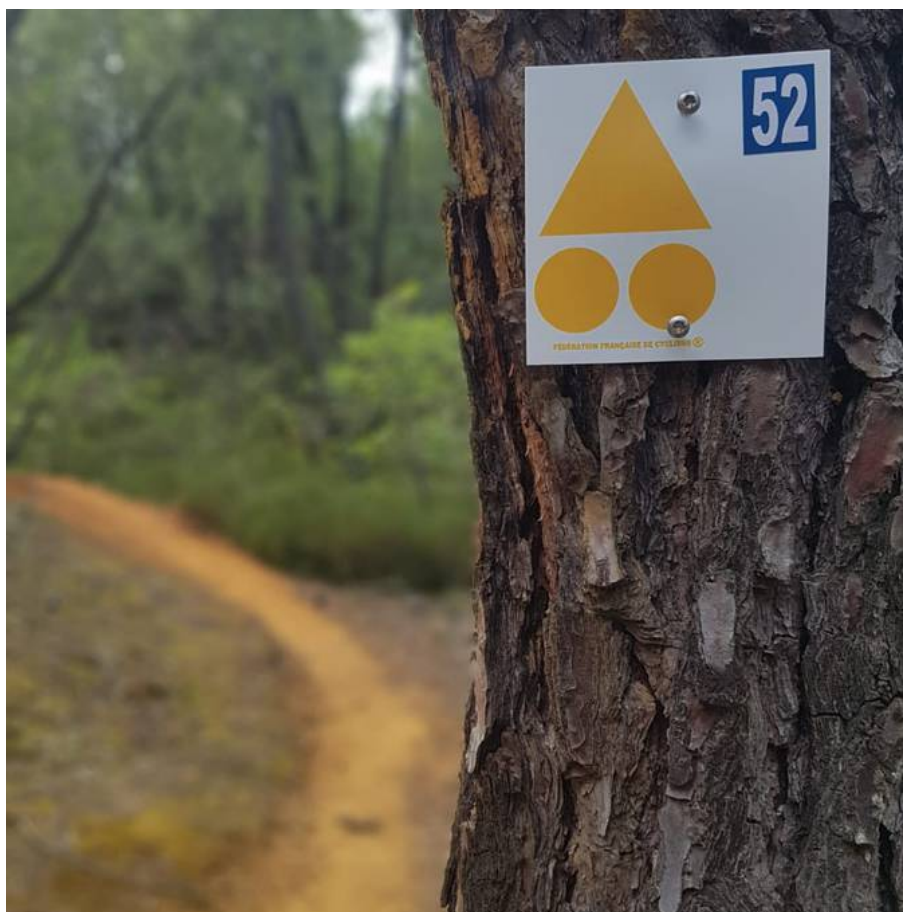
Exemple de balise.