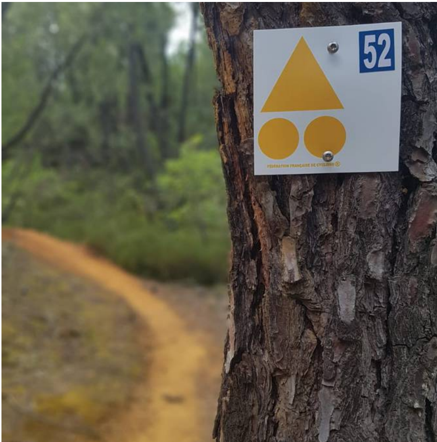
Exemple de balise.