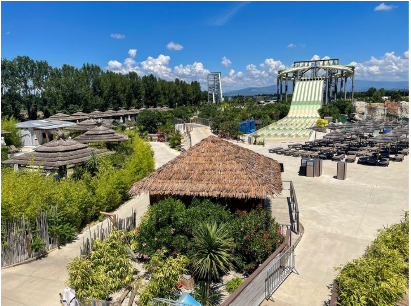
Vue splendide depuis le rooftop.

une cible 30+, le 'rooftop' permet de vivre une expérience de qualité dans un cadre plutôt atypique. Par ailleurs il est également possible de privatiser le bar ou le Rooftop pour un anniversaire, ou un évènement d'entreprise.