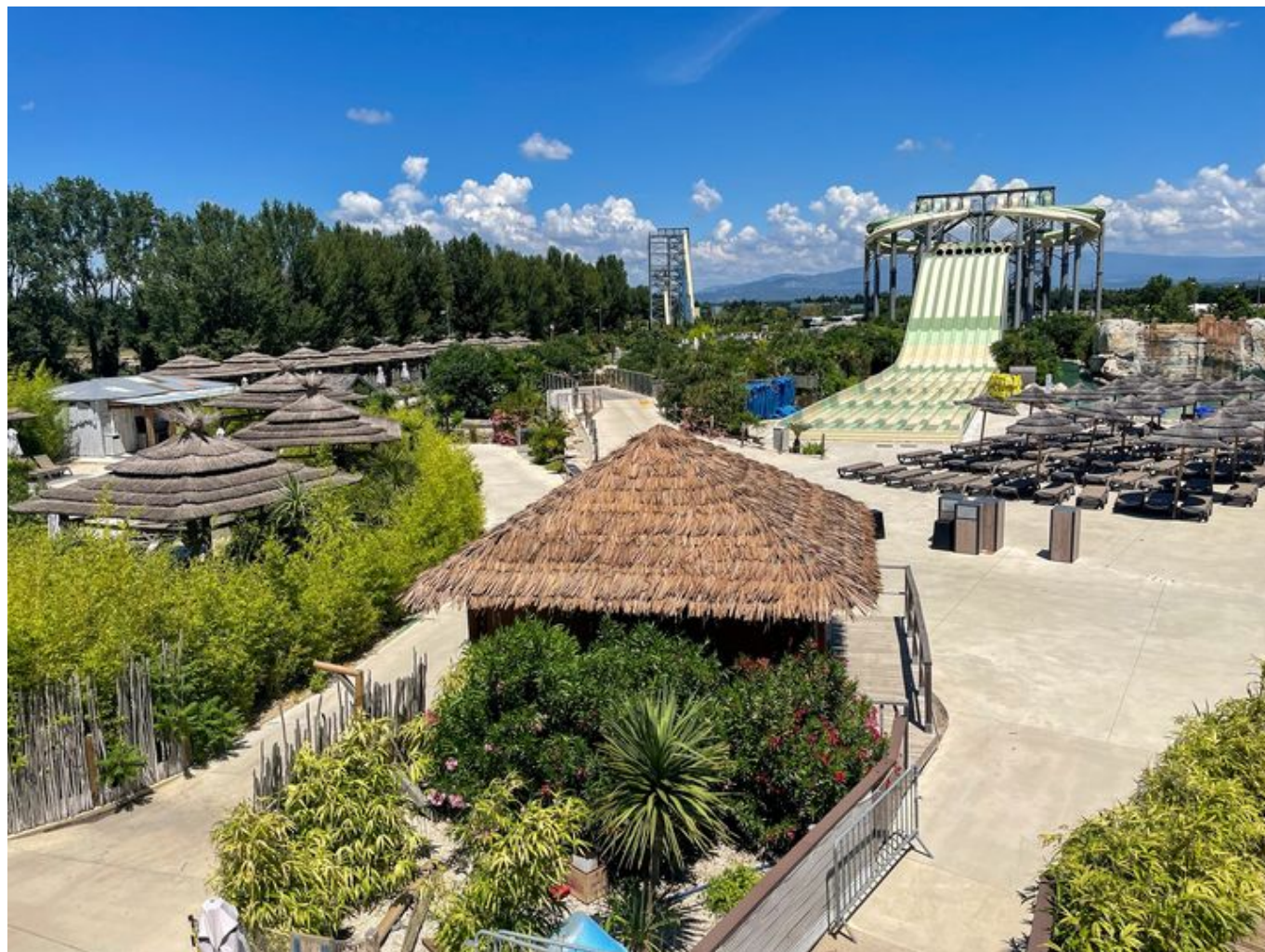
Vue splendide depuis le rooftop.

une cible 30+, le 'rooftop' permet de vivre une expérience de qualité dans un cadre plutôt atypique. Par ailleurs il est également possible de privatiser le bar ou le Rooftop pour un anniversaire, ou un évènement d'entreprise.