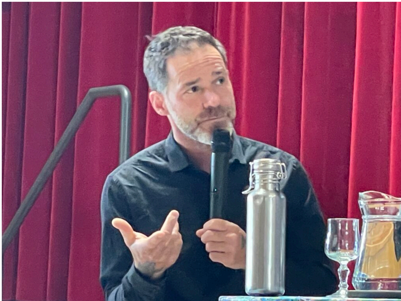
Jérémie Pichon Copyright MMH