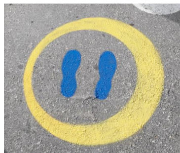
Matérialisation des distance sous forme ludique